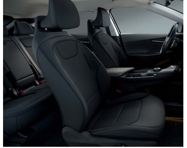
EV6 Air Pro, Plus & Premium WK - Schwarz Sitze aus veganem Leder