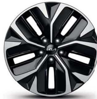
EV6 GT-line (nur in Verbindung mit 58 kWh Batterie) Leichtmetallfelgen 19 Zoll mit 235/55 R19 Bereifung