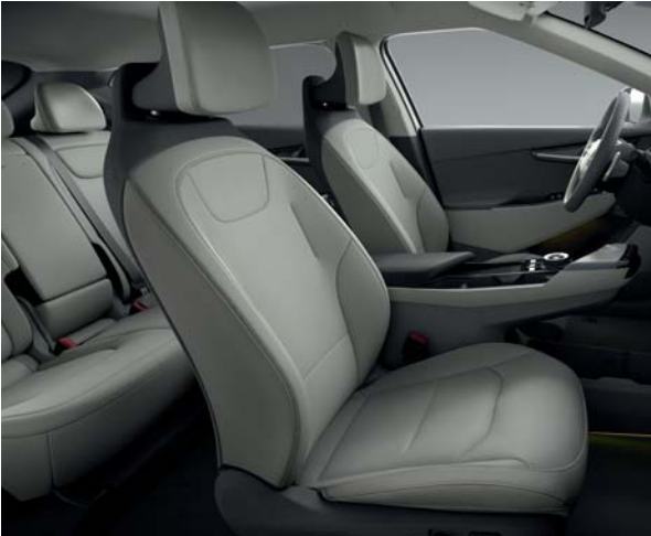
EV6 Air Pro, Plus & Premium CVH - Grau/Schwarz Sitze aus veganem Leder