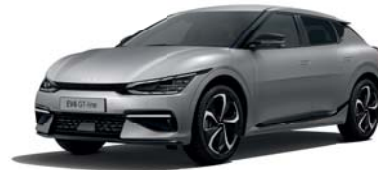
Moonscape Matte (KLM) 3,4