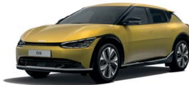
Urban Yellow (UBY) 2 (erst ab Dezember 2021 bestellbar)