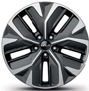
EV6 Leichtmetallfelgen 19 Zoll mit 235/55 R19 Bereifung