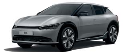
Steel Gray (KLG) 2