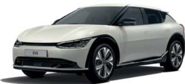
Glacier (GLB) 2