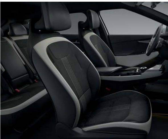
GT-line WK - Schwarz/Weiß Veloursledersitze mit Applikationen aus veganem Leder