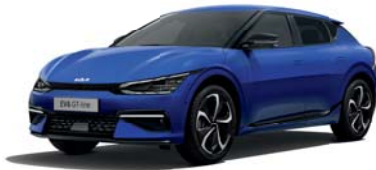
Yacht Blue (DU3) *2