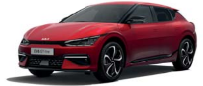
Runway Red (CR5) 2