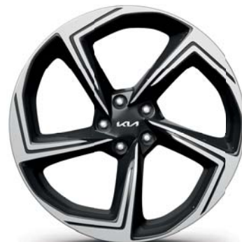
EV6 GT Upgrade Leichtmetallfelgen 21 Zoll mit 255/40 R21 Bereifung