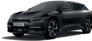
Aurora Black (ABP) 3