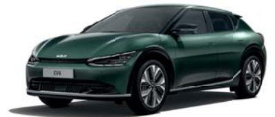
Deep Forest (G4E) 2