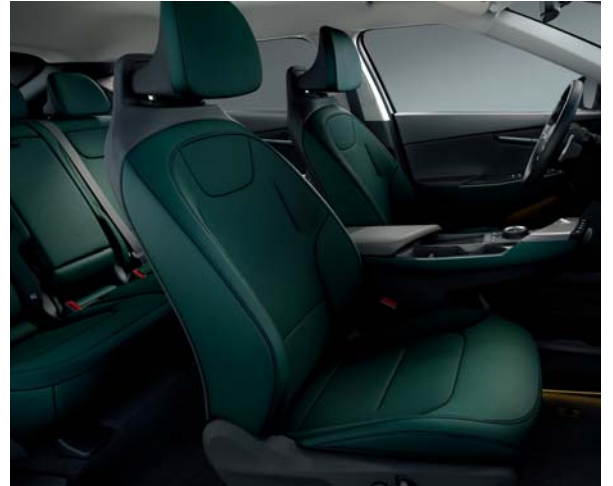
EV6 Air Pro, Plus & Premium CGP - Dunkelgrün/Schwarz Sitze aus veganem Leder