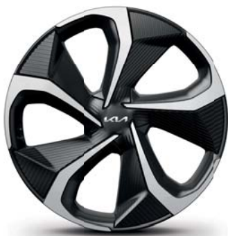
EV6 GT-line (nur in Verbindung mit 77kWh Batterie) Leichtmetallfelgen 20 Zoll mit 255/45 R20 Bereifung