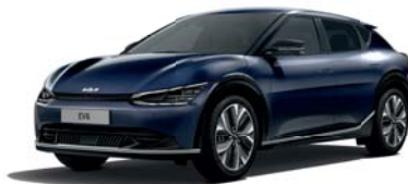
Gravity Blue (B4U) 2