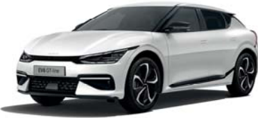
Snow White Pearl (SWP) 3