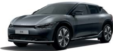
Interstellar Gray (AGT) 2