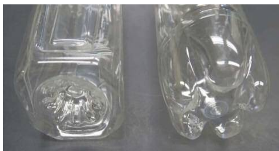
写真2 ボトル底部の形状