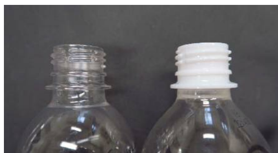
写真3 注ぎ口の形状

当センターにも容器の膨張等に関する問い合わせが寄せられることがありますが、その多くは微生物が起因すると考えられます。便利なペットボトル飲料ですが、適切に利用することが大切です。