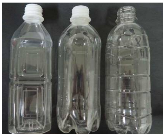
写真1 ボトル胴部の形状

ペットボトル飲料は再封して持ち運びやすいので、外出時など鞆の中に入れておく方も多いですが、微生物が関与するトラブルを引き起こす可能性があります。そこで、モデル実験を紹介します。直接口につけて飲むことを想定し、開封後に唾液を滴下したペットボトル飲料を、夏の日中の気温を想定した 35℃で保存して微生物菌数を測定しました。その結果、4時間で10倍、1日経過すると10,000倍に増加するケースがありました。内容物によって菌数の変化は異なりますが、開封後は早めに飲み終えるように情報提供をする必要があります。