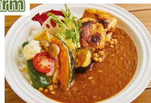
Cfarm 人気の野菜カレー