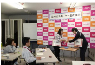
受講時のロールプレイングの様子

うるま市役所福祉部介護長寿課さまと連携し、講座を受講することで従業員が認知症に関する理解を深め、ホスピタリティあふれる行動を率先することにより、お客さまに安心してお買い物を楽しんでいただける環境を整えていきます。