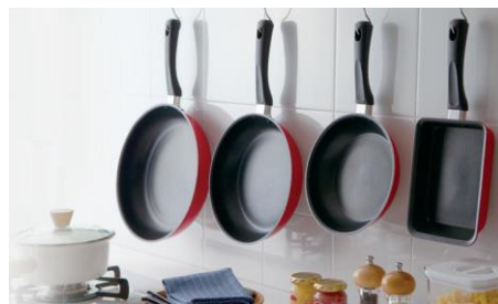
〈商品一例〉 寝具、軽量ハードコートフライパン