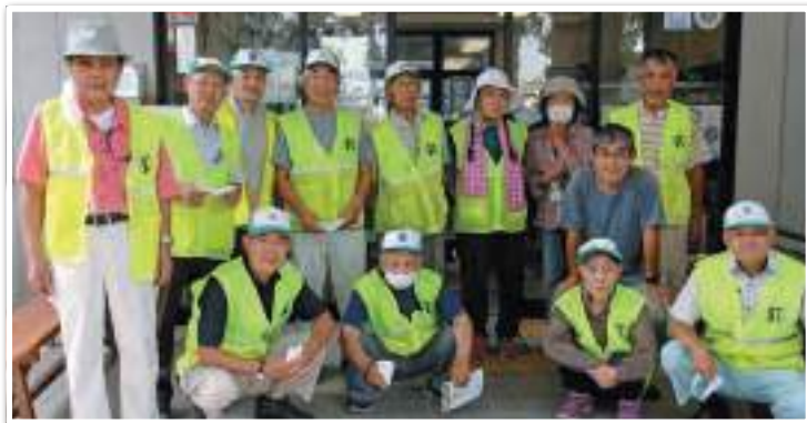
桜堤遊歩道清掃ボランティア令和4年7月20日

シルバー人材センターについては勤務先の事務所へ「いぶしぎん」その他、関係資料を事務局職員のお二人が届けてくれましたので数年間、読む、話す、掲示が続きました。シルバー人材センターについてはある程度理解していたつもりでシルバーの入会説明会に出席、ところが当時のシルバー人材センターの会員の平均年齢が六十四歳位であったためか最初の説明で入会が遅すぎるとの話。