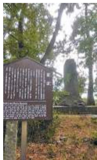
有名な信玄VS謙信の直接遭遇戦「三太刀七太刀」の銅像と首塚。幕末の松代真田藩主幸教に仕えたという同郷の田中父子の歌碑。「跡偲ぶ川中島の朝嵐息吹の早霧面影に見ゆ」（月洒亀磨・田中亀太郎）。「月影の入りにし後も不如帰一声残す（人声遺す）小島田の里」（月洒亀守・田中亀作）。