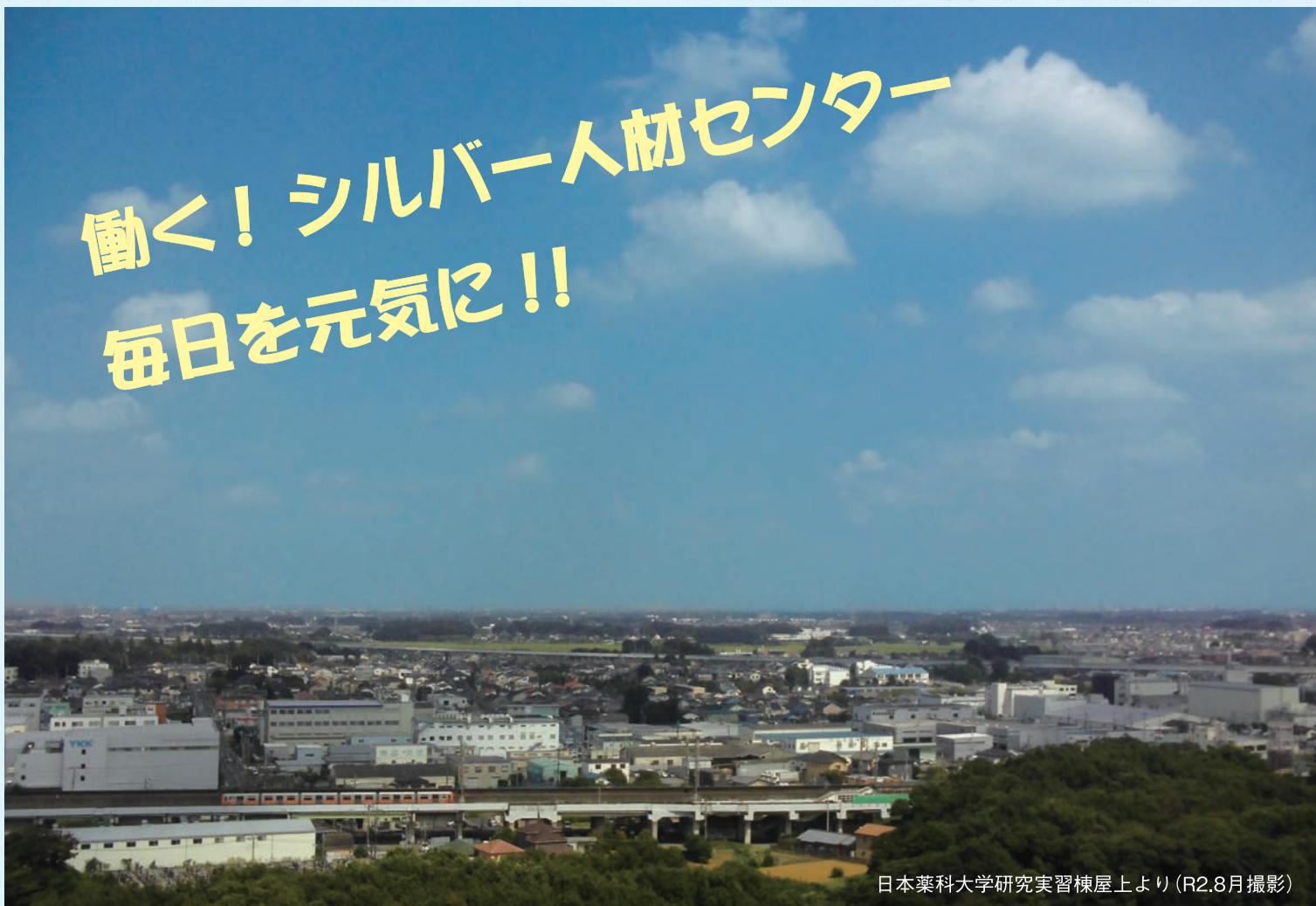
日本薬科大学研究実習棟屋上より (R2.8月撮影)