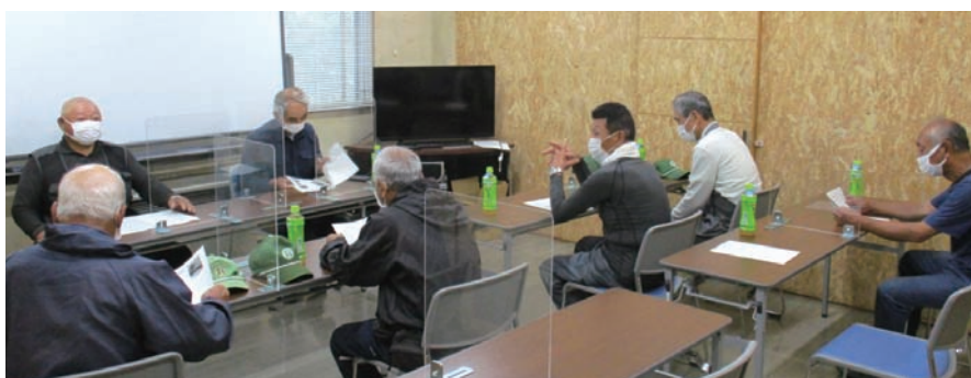
安全な作業に向けて

3月27日から4月2日ま で無線山の「さくらまつり」 が開催され、当センター会 員も駐車場料金の 徴収や清掃の お仕事に従事し ました。