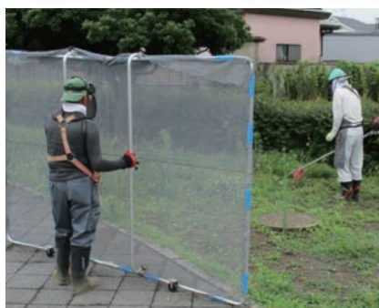
ネットで飛石防止

去る6月30日、安全適 正就業の一環で、刈払機 を扱う機械除草班による 研修会が行われ、安全作 業のための再確認をし ました。