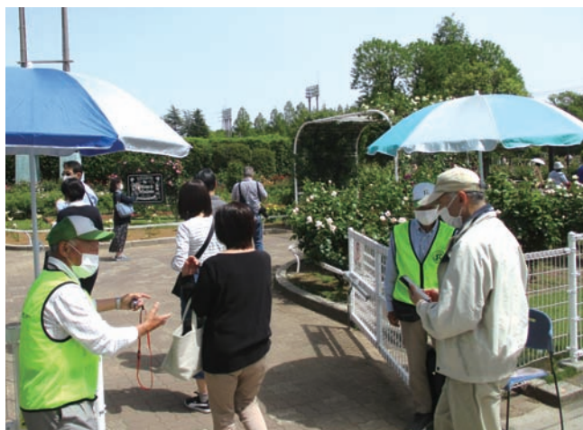
ようこそバラ園へ