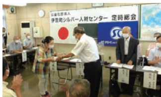
会員受賞者を代表して太田会員(左)