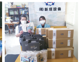
購入者：(有)新垣設備

毎年7月の「地元企業優先使用並びに地元産品奨励」と併せ、うるま市地元産品の消費を通じた地域事業者の支援として、うるま市観光物産協会と連携を図りながら、7月3日(金)にうるま市役所1階にて「うるま市のすぐりむん展示販売会」を開催し市民へのPRをするとともに、事業者支