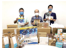
購入者：沖縄電力株うるま支店