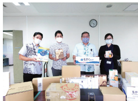
購入者：うるま市役所