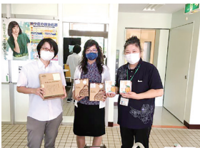
購入者：電源開発株