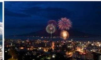
Downtown of Kagoshima and its symbol, Sakurajima. Kagoshima is one of the few cities in the world with an active volcano