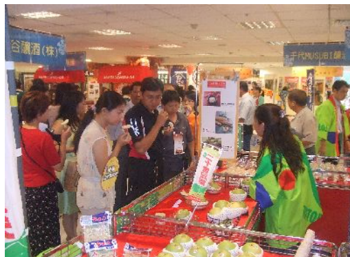
二十世紀梨は大人気