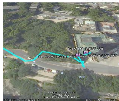
写真上：GPS 写真下：筆者が北投温泉に行った行程

回もそのときの雰囲気思い出し楽しめる。ちなみに「GARMIN」は、台湾の旧型機が日本円12万円(台湾は新型機が5万円)。「HOLUX」は日本で1万2千円(台湾では7千円)。日本は高い。