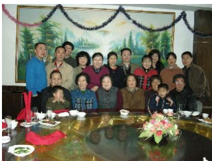
旧正月は家族の待つ故郷へ帰る

日本では家族団楽ということが少なくなってきたように感じるが、中国においては、親への感謝の気持ち、親を敬う気持ちが強く残っている。1年のうちで最も重要とされている旧正月には、駅や空港、長距離バス乗り場が里帰りする人でごった返す。家族の待つ故郷に帰ったら、就労地、就学地の名産物を手渡し1年の労をねぎらう。日本では見受けられなくなった家族団楽の光景を、中国人と結婚