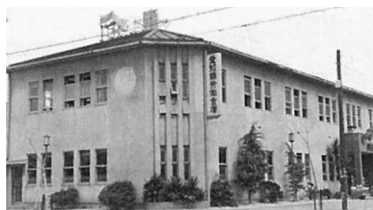
1952年 愛知労金の最初の拠点