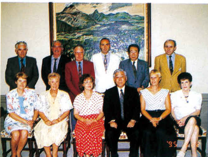
▲知事を表敬訪問するフランス・ヴォークリューズ県のプロヴァンス・ジャポン協会のメンバー10名

今年で3年目になる「フランス・ヴォークリューズ県ホストファミリー受入事業」は、栃木県からヴォークリューズ県に派遣される「婦人の翼」や「青年の翼」等の各種訪問団のホームステイに協力している「プロヴァンス・ジャポン協会」のメンバ