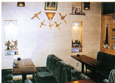
▲タイの雰囲気ですばらしい店内

「メナム」はタイの食文化をそのまま日本に取り入れたいというオーナーの考えに基づいて、タイの精髓を極めた料理を厳選し