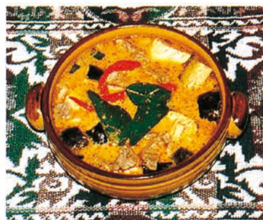
◀コクのある味と辛さで人気のグリーンカレー

おすすめ料理といえば、タイの代表的料理「トムヤムクン」（海老のスープ）、人気料理「プーパット」（蟹と春雨とセロリの炒めもの）と「ゲンキョウワン」（グリーンカレー）、「クワイテオ」（ビーフンを使ったタイ式ラーメン）、それに「トートマンブラー」（日本のさつまあげのルーツといわれているものを唐がらしとピーナッツと酢を合わせた特製ソースにつけて食べる）だ。ランチセットは土・日・祝祭日を問わず毎日やっており、全4種類、各1,000円のお手頃価格。人気のメニューはセットの中に組み込まれているので、タイ料理は初めてという方でも手軽にオーダーができる。ほかにデザートとしてメナム特製のココナッツアイ