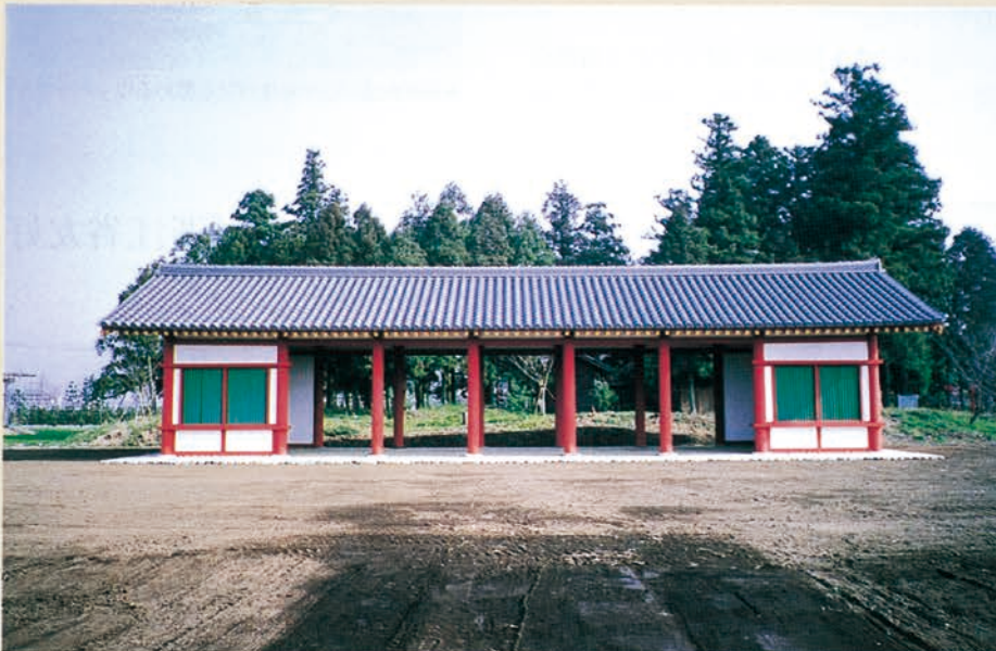
▲栃木市の下野国庁跡に復元された「前殿」

ヴォークリユース県からホストファミリーが来県 平成7年度浙江省友好交流員が出發 矢板中央高校サッカークラブ タイ料理の店「メナム」 佐野市国際交流協会 とちぎインターナショナルフェスティバル'95開催