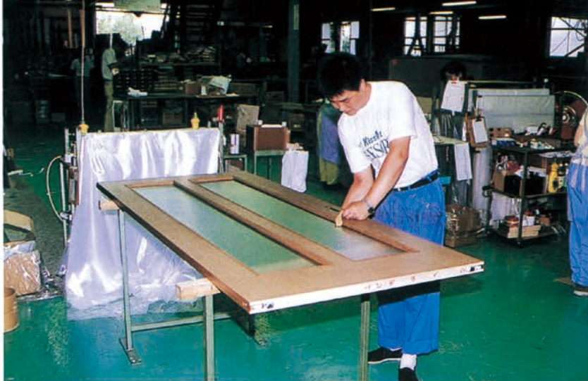
▲中国から技術を学びに来た研修生（鹿沼市木工団地内・株式会社ハーティスにおいて）

外国人研修制度は、研修生が日本の企業等で実務を通して研修を行い、習得した技術や知識を母国で活用し産業の振興に役立てることを目的としている。