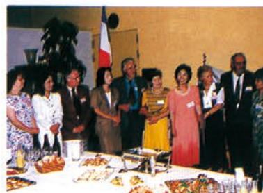
▲歓迎会で日本のホストファミリーと再会