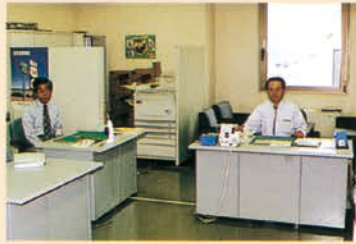
◀JITCO宇都宮駐在事務所

(財)国際研修協力機構 (JITCO) は外国人研修生制度の拡大・発展を図るために、外国人研修生の受入れを行う団体・企業に対して総合的な支援・サービスを行うことを目的として1991年9月に設立された。なお、1993年4月から創設された「技能実習制度」の実施に当たっては最も重要な役割を担っている。宇都宮駐在事務所が設けられたのも1993年の4月である。