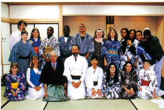
◀姉妹都市ランカスター市中学生のホームステイ受入れ

最初に取り組んだ事業が、佐野に住んでいる外国人を対象としたアンケート調査（4か国語）でした。外国語表記のガイドマップ作成、日常生活に必要なハンドブック作成（2か国語）、日本語教室（参加者の言語別