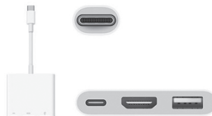
付属外部出力ケーブル例