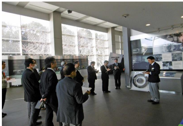
< 見学風景 >