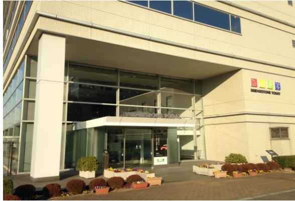
< 外観 >

開館日時：月曜日～土曜日午前 10 時～午後 4 時（入館は午後 3 時 30 分まで） （日曜・祝日は休館） 入館料：無料 電話番号：042-342-6363