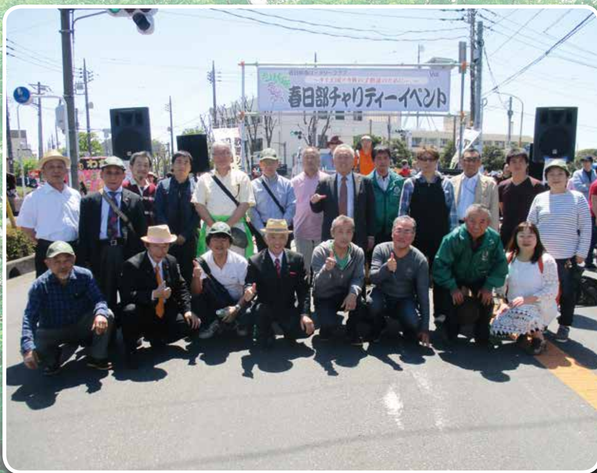
春日部チャリティーイベント (第6グループ春日部南 RC)