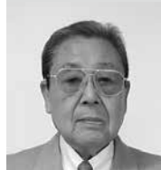
㈱恩田建設不動産 (八潮)