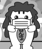
沖縄県選挙 キャラクター キジムン

有権者の皆様につきましては、投票所におけるマスク着用、咳エチケットの徹底をお願いいたします。