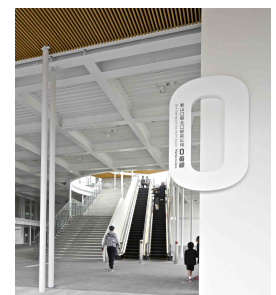
新山口駅北口駅前広場「0番線」 南北自由通路 第18回公共建築賞(2023) 「公共建築賞・優秀賞」