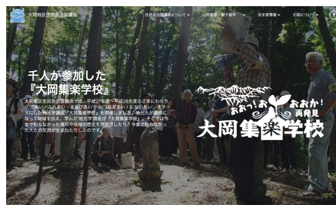
大岡の歴史・民俗誌ページ

H27-28年に開催された地域の歴史・史跡を巡った集楽学校の資料を始め、現在行われている聞き書きの資料などの情報も続々掲載予定です。