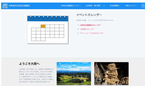
大岡の行事予定も掲載