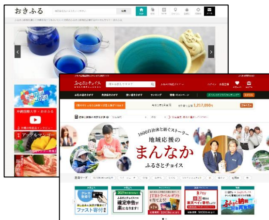
各種ふるさと納税サイト