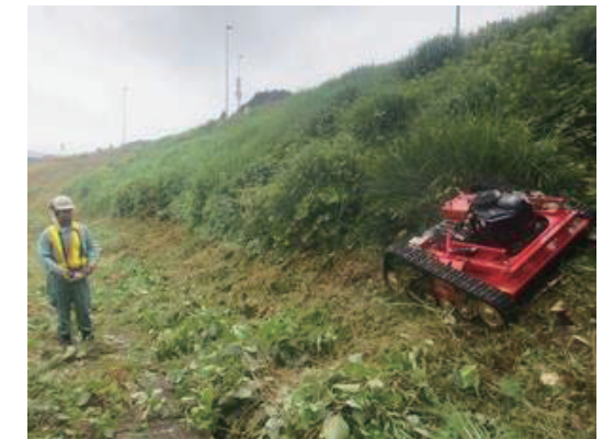
リモコン式大型草刈機を操作する様子

また、産業医とともに、定期健康診断やインフルエンザ予防接種を行い職員の健康管理を行っています。