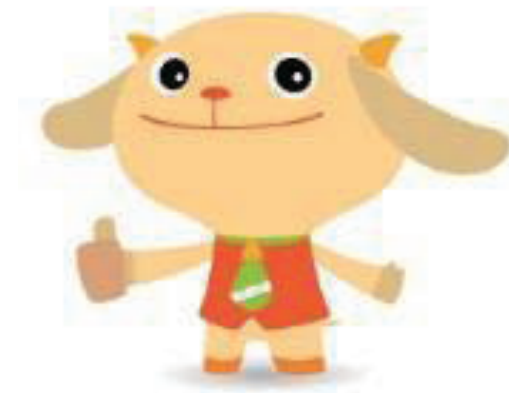
沖縄県グッジョブ運動マスコットキャラクター ジョブたん