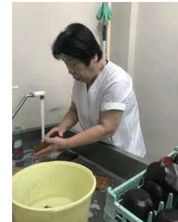
厨房で働く女性（73歳）