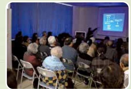
北部保健所による食品衛生法の講習会等

上記以外にも、ホスピタリティアップへの取り組みとして、各種文化講座・自然体験（ガイド）講習の実施、旅館業法や消防法取組にむけた説明会・講習会などを随時開催しています。