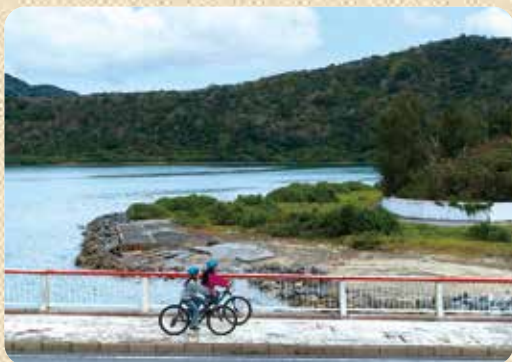
A6 サイクリング体験