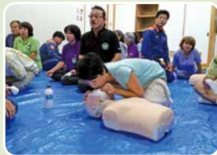
救急蘇生法講習会