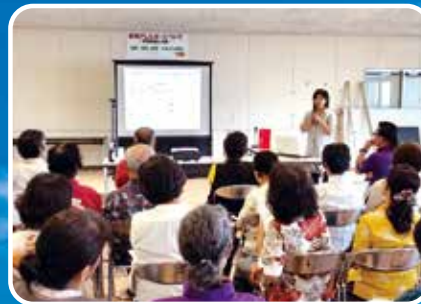
アレルギー講習会