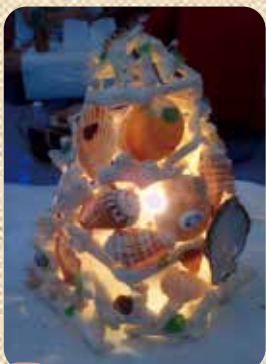
C4 シーランプシェイド作り