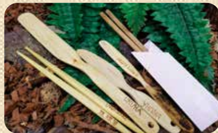
C5 シークワサーの木で作る (マイはし・料理用ヘラ作り体験)