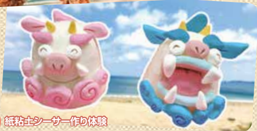
C3 紙粘土シーサー作り体験