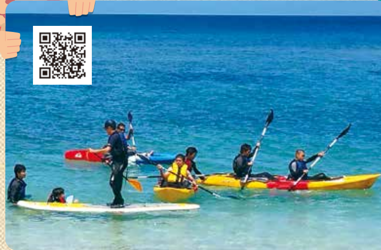
マリン体験プログラム②シーカヤック・SUP