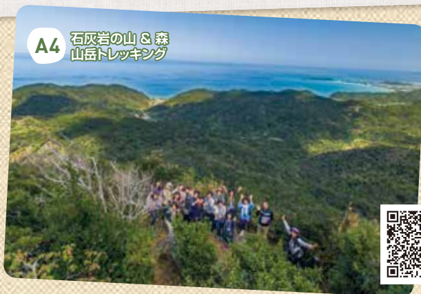
A4 石灰岩の山 & 森山岳トレッキング