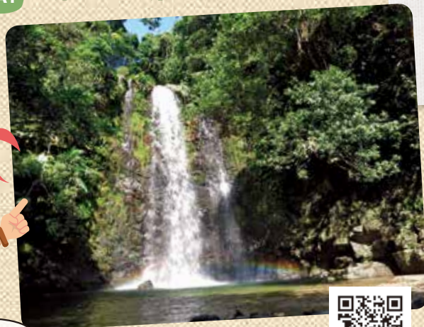
A1 ター滝トレッキング&滝つぼ遊び