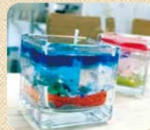
C6 ジェルキャンドル作り