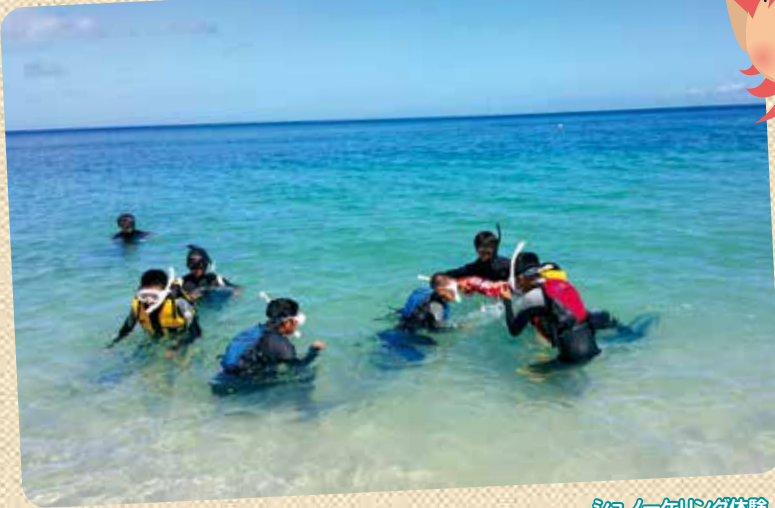
シュノーケリング体験