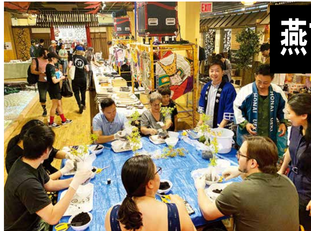
プロジェクション・マッピングで日本庭園を泳ぐ鯉を楽しむ子どもたち▼

朝からニューヨークの有名シェフたちが買いにきてくれた」と語る。 燕市・三条市は食器で世界的に知名度があり、今回カトラリーの展示コーナーでは元デンマーク王室御用達のデザイナーとコラボして作ったブランドICHIや高級レストラン向け、家庭向けのフォークやナイフ、スプーンが展示販売された。ブースで接客に当たったつばき税理士法人の山田眞一氏は「皆さん、デザインが素晴らしい」と人気を理由に説明する。と人気を理由に説明する。と人気を理由に説明する。と人気を理由に説明する。