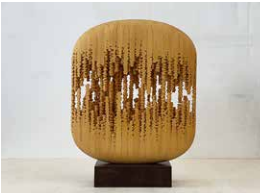
デザイン科 橋本和幸(教授) Clammbon