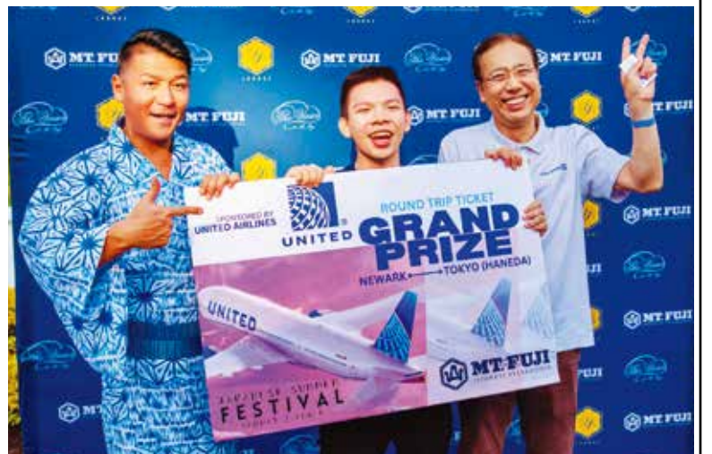
ラッフル特別賞(協賛ユナイテッド航空)