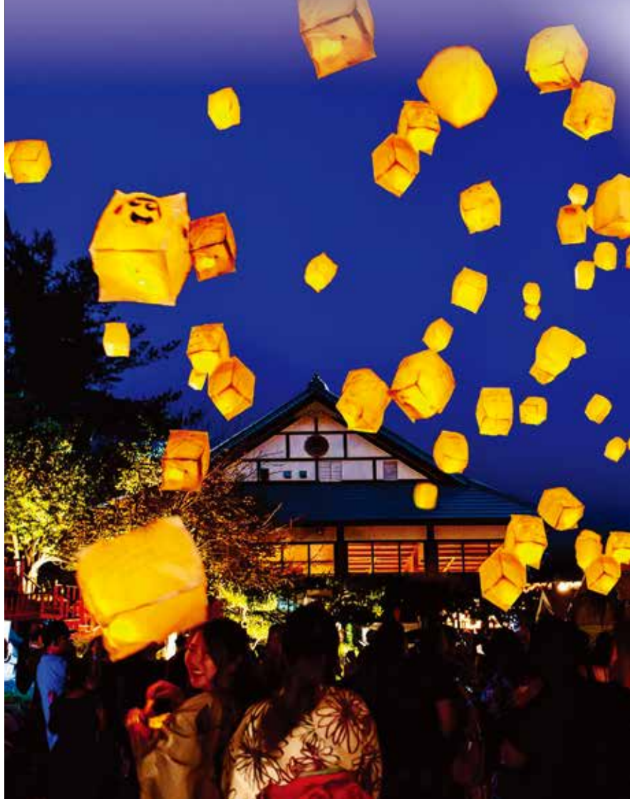
イベントのフィナーレはLEDスカイランタンで

NY郊外の山頂にそびえる巨大な日本建築のレストラン「マウント・フジ」は6日(日)、昨年(2022年)に続き第3回目となる「夏祭り」イベントを開催した。今年も参加を待ち望んでいた人々の心を射止めた同イベントは、前売り券もすぐに完売。当日は約600名の参加者が集い、大いに盛り上がった。