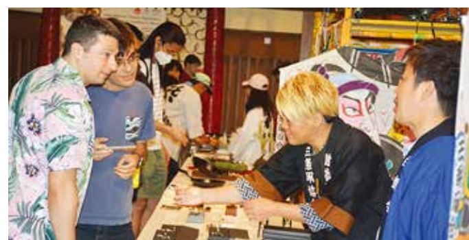
来場者に商品を説明する結城団長