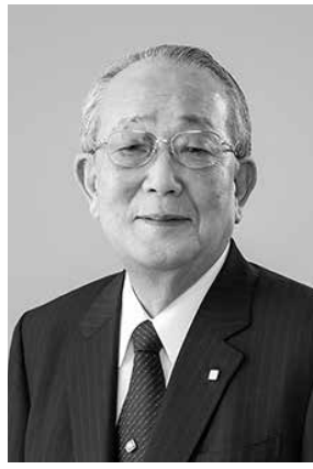
稲盛和夫 Inamori Kazuo

1932年-2022年 鹿児島生まれ。1959年4月、京都セラミック株式会社(現京セラ)を設立。2005年からは名誉会長。また1984年、第二電電企業株式会社を設立。2000年10月、DDI(第二電電)、KDD、IDOの合併によりKDDI株式会社を設立。2001年6月より最高顧問。2010年2月、日本航空会長に就任。2015年4月に名誉顧問。一方、1983年から2019年末まで、ボランティアで、14,938人の経営者が集まる経営塾「盛和塾」の塾長として、経営者の育成に心血を注いだ。1984年には私財を投じて稲盛財団を設立。同時に国際賞「京都賞」を創設し、毎年、人類社会の進歩発展に功績のあった方々を顕彰。