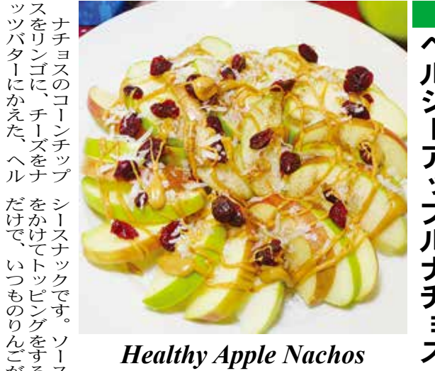
Healthy Apple Nachos

【材料】(1本分) バナナ.....1本 無糖ココアパウダー.....適量 シナモン.....お好みで少量 マシュマロ.....適量 お好みではちみつまたはメープルシロップ.....適量