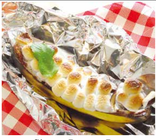
S'more Banana Boat

いつもとはちよつと違うスモアは、底になる部分の皮を包丁で少し落として、増してさらにおいしくなり増します。チョコレートの代わりに、ココアパウダーで甘さ控え目に。とろつ、サクツとしたマシュマロとお楽しみください。 準備 オーブンは190℃(375F)に設定する。オーブンの天板にアルミホイルを敷く。 作り方 1 バナナは両端のヘタを包丁で少し切り落とし、中央部分の皮を切り取り、準備した天板におく。 *バナナを置いて安定しない場合は、底になる部分の皮を包丁で少し落として、ココアを茶こしに入れて、果肉全体にふる。好みでシナモンもふる。 3 マシュマロを全体にのせる。 4 オーブンの中段に入れて、10〜12分ほどまたはマシュマロに焼き色がつくまで焼く。 *1 マシュマロをバナナにのせても落ちてしまう時は、果肉を指で押し少しくぼませると安定します。 *2 マシュマロに十分な焼き色がついてもバナナが柔らかくならない場合、オーブ