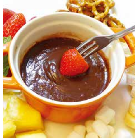
Chocolate Fondue for One

【材料】(1人分) チョコレートソース.....60g チョコレートチップ*1.....大さじ1.5 牛乳.....大さじ1.5 いちご、プレッツェル、マシュマロ、パイナップル、バナナなど*2 *2 トッピングは他にも刻んだナッツ類・プレッツェル、レーズン、チョコレイトチップ、スプリングルなどお好みで。