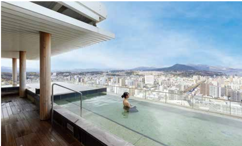
CITY SPA てんくう