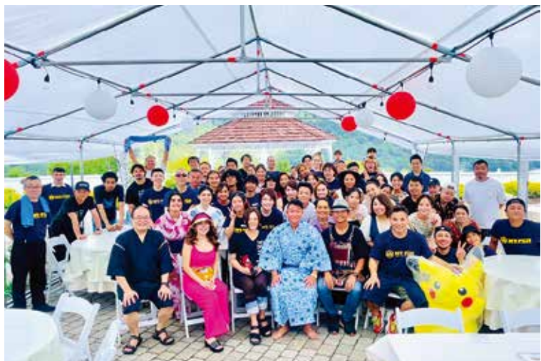
出店・出演者とスタッフ一同