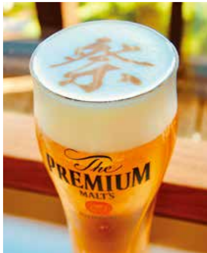
Ripplesの泡アートビール

同イベントを実現させるにあたり、コリン、ユナイテッド航空、共同貿易、ウイズメタック、JFC、サントリー、伊藤園、茅乃舎、アズマフード、いちごUSA、Sakurai Kimono & Styles、リトル・ジャパンUSAなどの企業からのサポートもあり、「皆様からの多大なご協力のおかげで、この夏祭りが今年も開催出来ました」と