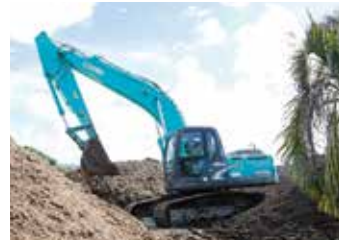
事業再構築補助金で購入した自走式木材破砕機とユンボ