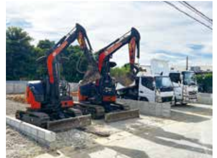
マル経融資で購入したダンプとショベル