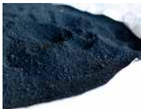
ふるいにかけて、堆肥と混ぜ合わせる

また、「弊社の主力商品である赤土流出防止効果のあるオリジナル専用土『ファームソイル』の販路の拡大に取り組み、海上に流れ込む赤土流出を防ぐことで沖縄の自然環境を守っていきたい」と語りました。