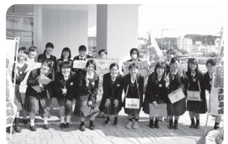
「街頭募金」イオンタウン南城大里(向陽高校)