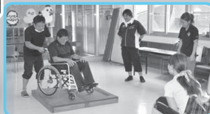
仁愛療護園の職員が指導にあたる