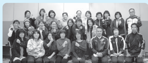
オレンジリングを手に新たにサポーターが誕生