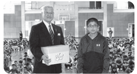
「学童募金」贈呈式(佐敷小学校)