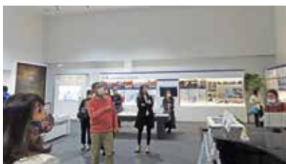
語り部による震災体験の説明