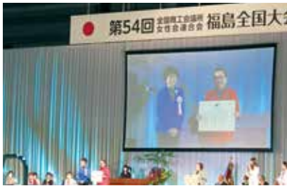
沖商女性会の宮城会長表彰風景