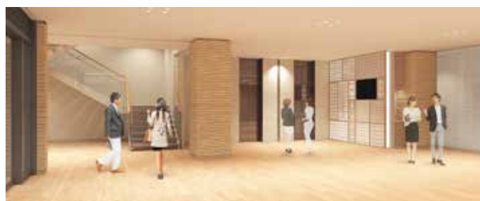
1階エントランスロビー