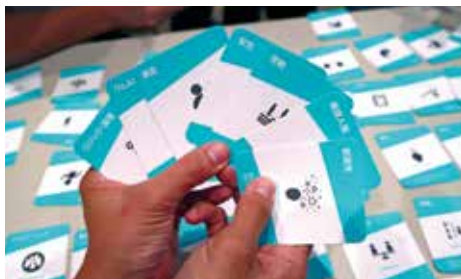
エンゲージメントカード