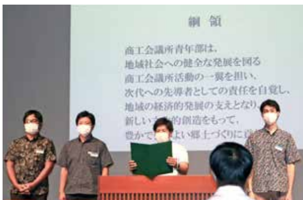
綱領朗読、指針唱和