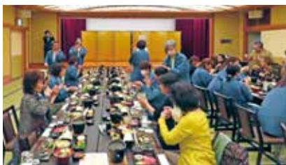
沖縄県連での懇親会風景