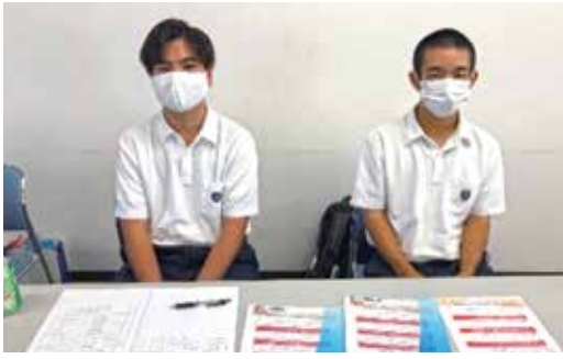
受付をお手伝いしてくれました小禄高校インターンシップの学生

ことで付加価値向上に繋げる事が出来、デジタルツールの導入手順として、課題の明確化と重要度、実現計画を立てる、デジタルツールを調査する、デジタルツールを検証し、導入するポイントをお話頂きました。