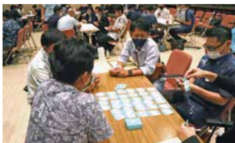
エンゲージメントカードによる研修中