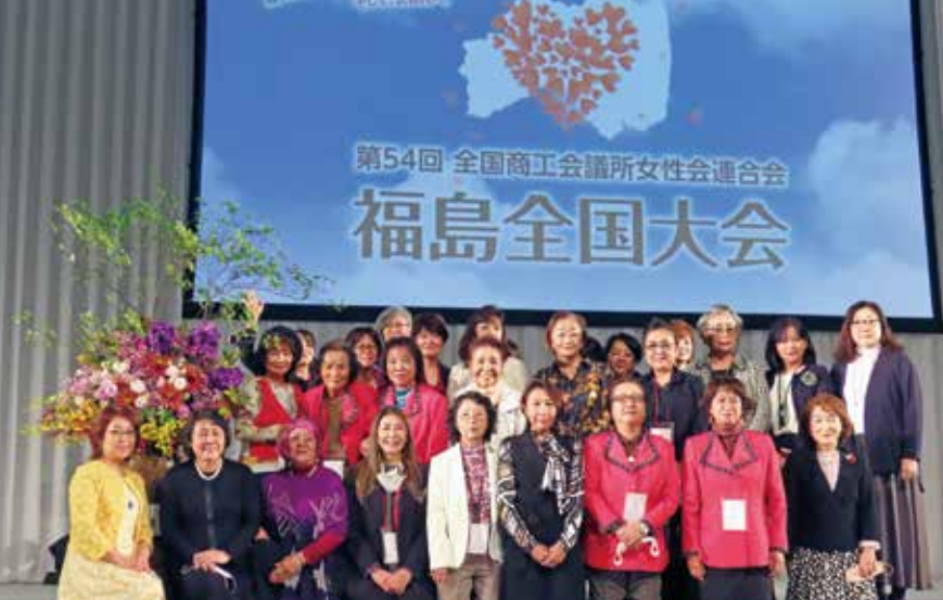
大会会場で記念撮影(ビックパレットふくしま)