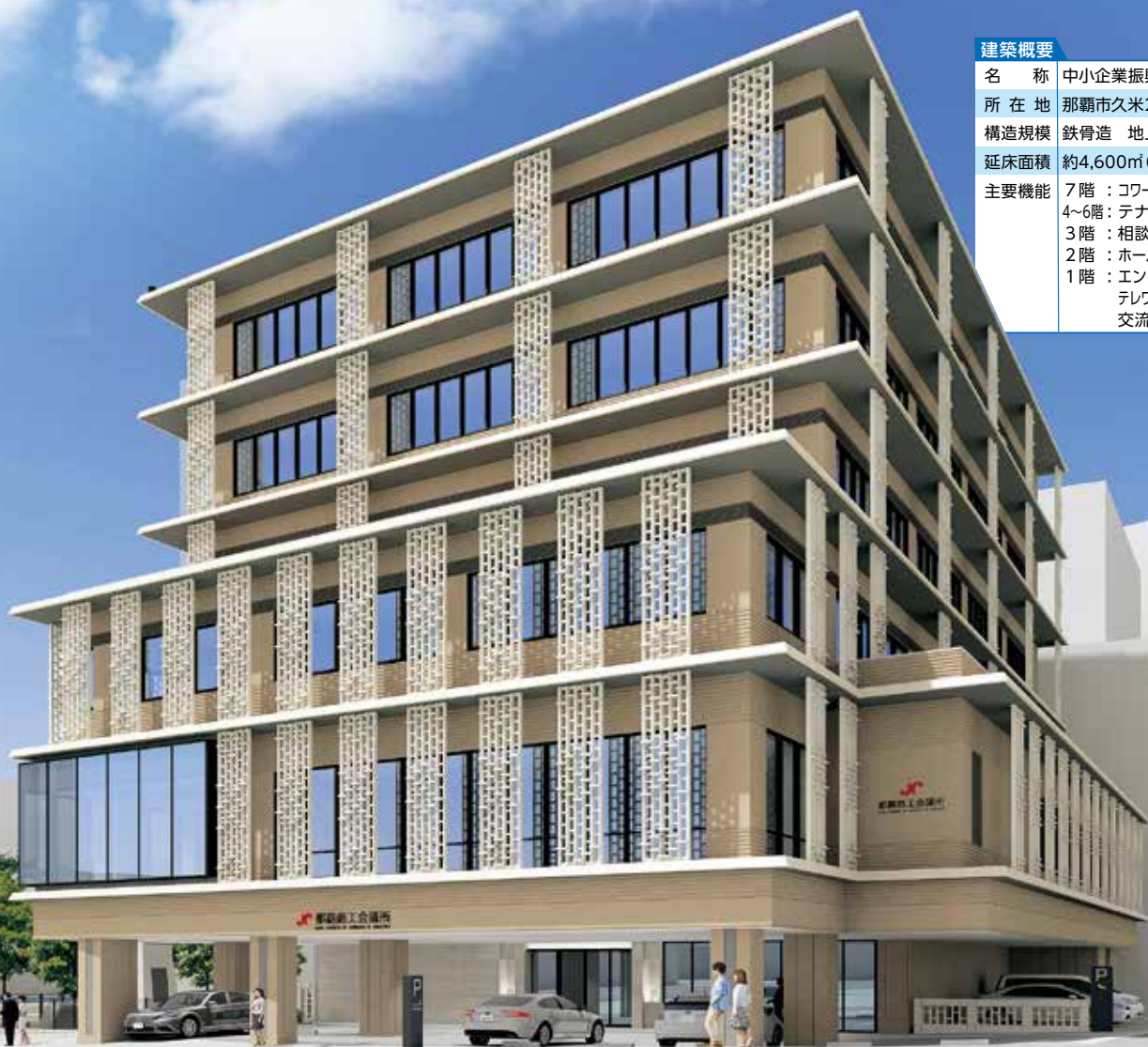
完成イメージ(北西方面から)

那覇商工会議所は、昭和2年の設立以来95年が経過しました。これまで中小企業の経営支援はもとより、地域経済の活性化、県経済の振興発展のために全力を尽くしてきました。