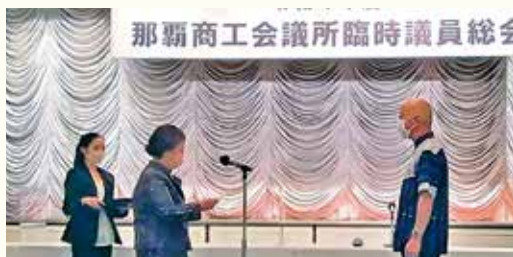
当選証書交付式の様子