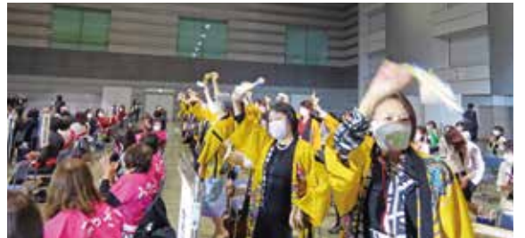
沖縄県連で一同に他県に挨拶