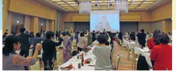
懇親会風景(磐梯熱海温泉華の湯)