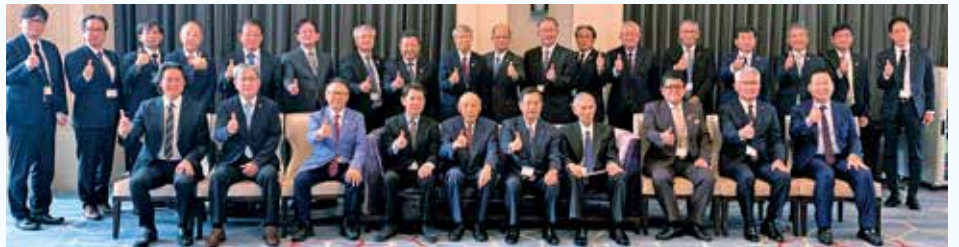
台日商務交流協進會との記念撮影