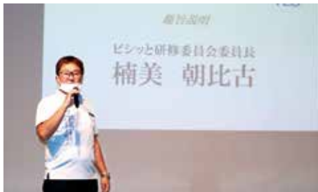
委員長挨拶、趣旨説明