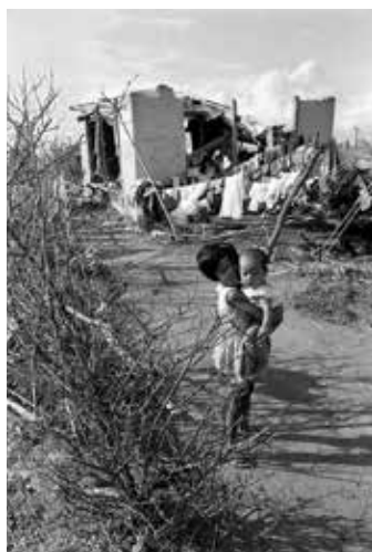
平良孝七《71.9石垣島》(名護博物館蔵)

沖縄県立博物館・美術館では、美術館企画展として「復帰50年 平良孝七展」を開催します。平良孝七は、沖縄県大宜味村喜如嘉生まれの写真家です。1939年に生まれた平良は、6歳の頃に沖縄戦を体験します。1959年、辺土名高校を卒業後、写真館などで仕事をしながら写真を学び、1970年、琉球政府の広報課に勤務します。同年に『写真集 沖縄《百万県民の苦悩と抵抗》(沖縄革新共闘会議編)』を発表。収録された写真のほとんどを平良孝七が撮影しており、「復帰」を前にして様々な問題が噴出した当時の沖縄の「いま」とらえています。その頃はベトナム戦争の真っ只中で、戦場に向けてフル稼働する基地の様子もまた色濃く伝えられています。基地とは無縁でいられない生活者の姿もまた平良は撮っており、人々の苦悩の姿も写されています。 1976年には、『平良孝七写真集 パイヌカジへ記録 1970年～1975年』を自費出版し、第2回木