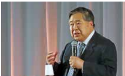
記念講演会講師：小泉名誉教授