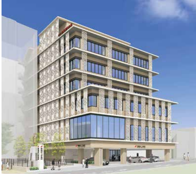
完成イメージ(北東方面から)