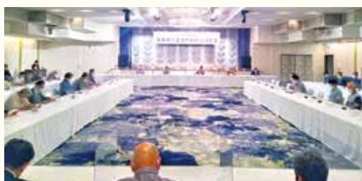
臨時議員総会の様子