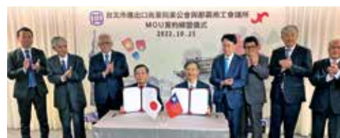
沖縄と台湾の経済交流促進へ