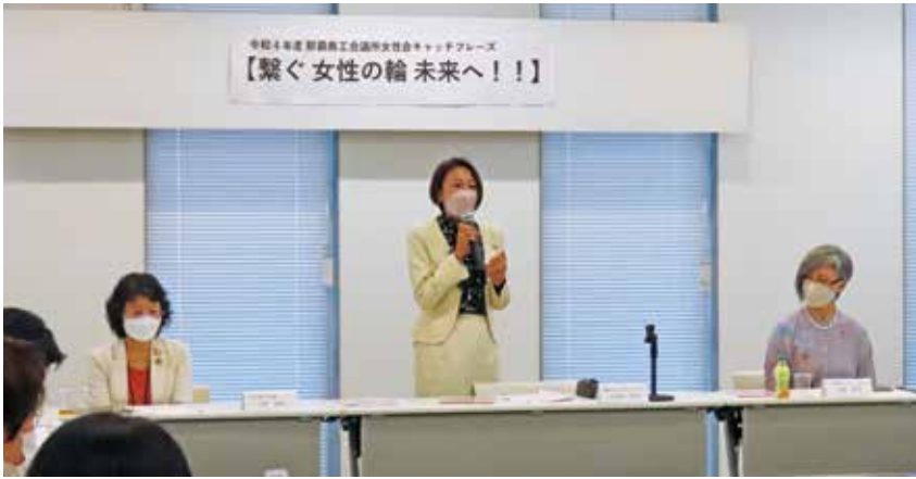
10月定例会 大宜見会長挨拶