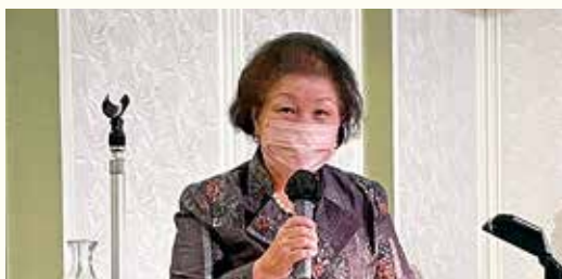
張本議員選挙副委員長による議員選挙選任報告