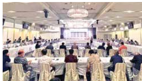
臨時議員総会を開催