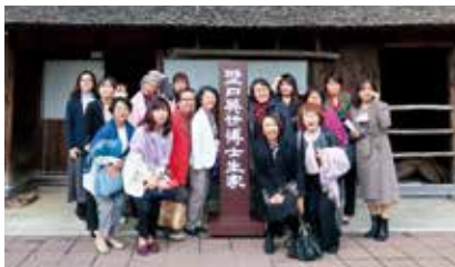
野口英世の生家前で記念撮影