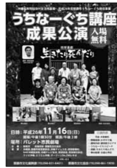
『うちなーぐち講座成果公演』