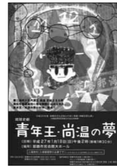
『青年王・尚温の夢』