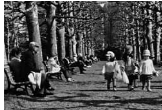
写真部門『プラタナスでの出会い』 松岡洋市