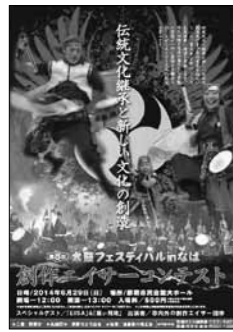
『創作エイサーコンテスト』