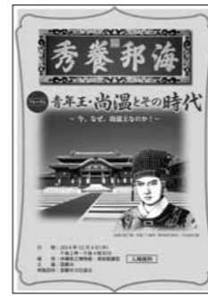
『青年王・尚温とその時代』