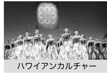
ハワイアンカルチャー