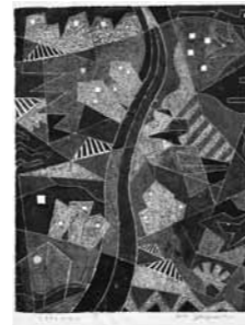
美術部門版画『ミラクルストリート』 新屋敷孝雄