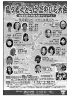
『島々ぬくとぅば語やびら大会』