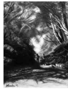
美術部門絵画『紅葉』 松長靖子