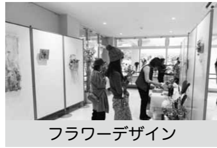
フラワーデザイン