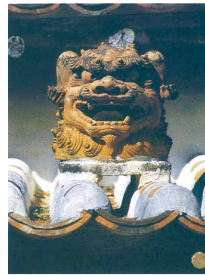
写真/第35回「那覇市観光写真・ポスター展」市長賞「壺屋」 板良敷 朝清