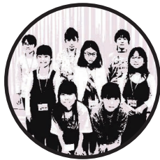
こと ジュニア箏体験教室の みなさん

このコーナーでは、長崎市の文化事業に背中を押され、新たな経験をした「スイッチパーソン」を紹介しつづけます。今回は「ジュニア箏体験教室」受講生のみなさんにお話を伺いました!