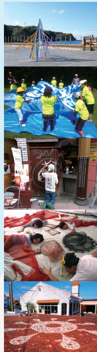
※写真は過去の長崎アートプロジェクトの様子です。

「じかんのちそう」は、長崎市野母崎地区を舞台としてエイジング（歳や時間を重ねること）をテーマに行うアートプロジェクトです。2020年3月より約1年間、野母崎地区の歴史や記憶、血脈について、国内外で活躍するさまざまなアーティストやクリエイターと共にリサーチを行い、歳を重ねることで見えてくる風景や失敗の共有、後世への継承など、この場所の未来を考えるためのきっかけを提示します。