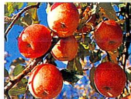
りんご園・ぶどう園