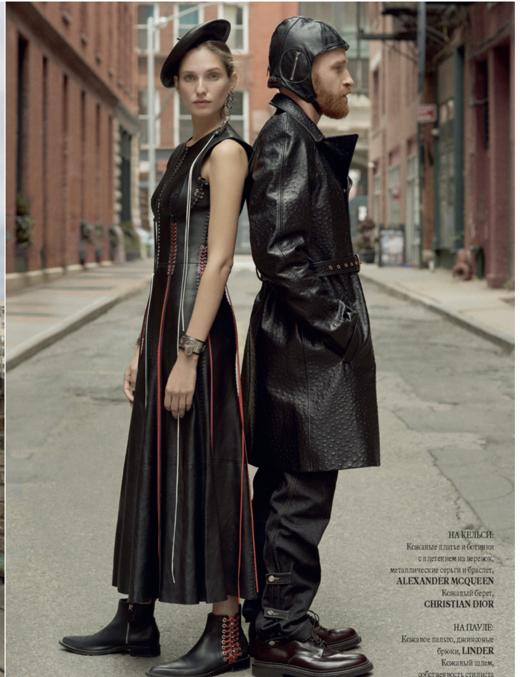
НА КЕЛЬСИ: Кожаные платье и ботинки с плетением из веревок, металлические серьги и браслет, ALEXANDER MCQUEEN Кожаный берет, CHRISTIAN DIOR