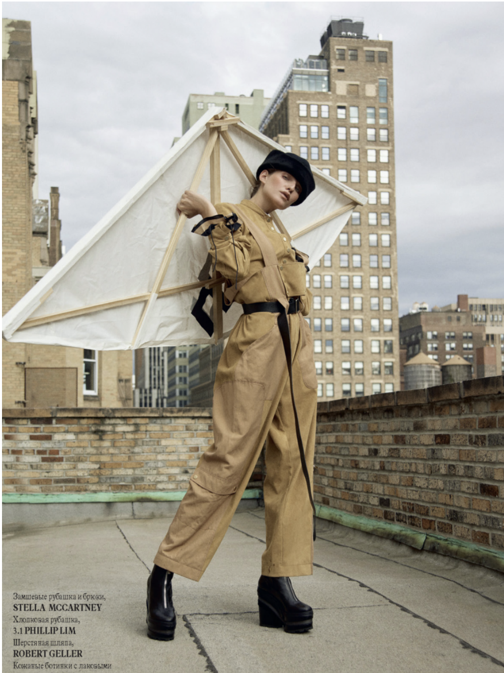
Замшевые рубашка и брюки, STELLA MCCARTNEY Хлопковая рубашка, 3.1 PHILIP LIM Шерстяная шляпа, ROBERT GELLER Кожаные ботинки с лаковыми