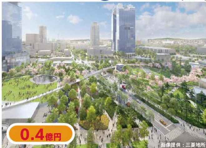
3 うめきたの森(桜園)