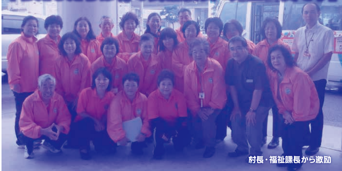
村長・福祉課長から激励

民生委員児童委員の日活動強化週間（H25年5月12日～18日）にちなんで、平成25年5月13日に北中城村内を広報車・マイクロバスに乗って、パレードをしました。地域を支えていく民生委員児童委員をより多くの方々に知っていただき、気軽に相談できる存在として民生委員児童委員がいることをPRしました。