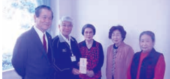
村老連・役員・各サークルの皆さん