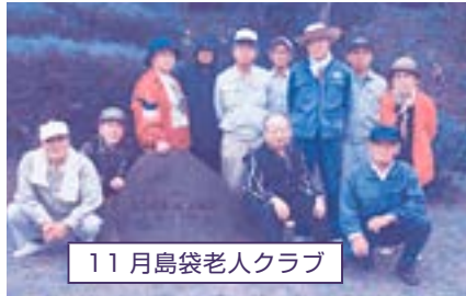
11月島袋老人クラブ