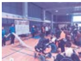
2連覇・優勝チーム パークサイド児童学園

今回、30チームの参加があり、村内の方々はもとより北は今帰仁村、南は与那原町からの参加があり、とても賑やかな大会になりました。今後もボッチャ競技の普及と、地域の皆さんが交流を通して参加出来る大会を継続していきたいと思えます。