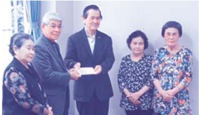
老人クラブ連合会からの寄付