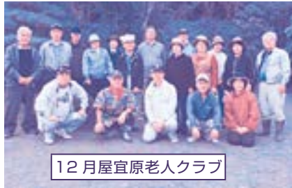
12月屋宜原老人クラブ