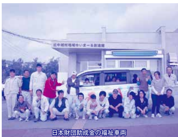
日本財団助成金の福祉車両