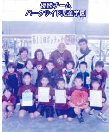
優勝チーム パークサイド児童学園

十二月の障害者週間にちなんで、パラリンピック正式種目でもあるボッチャ競技を通じたふれあい福祉交流会「第十一回ボッチャ大会」を平成二十六年十二月二十日、土曜日に県総合運動公園レクリエーションドームで開催しました。ちびっ子からお年寄り、体に障害のある方々すべてが楽しめるスポーツボッチャは、カーリング競技に似ています。