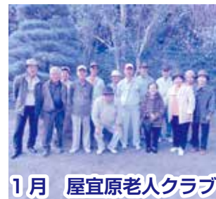
1月 屋宜原老人クラブ