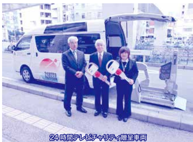
24時間テレビチャリティ贈呈車両