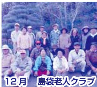
12月 島袋老人クラブ