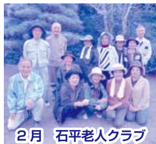
2月 石平老人クラブ

おかげさまで総合社会福祉センター周辺がいつもきれいです。 毎月第4金曜日各字老人クラブのみなさんが持ち回りで村総合社会福祉センター周辺の草刈り作業をして頂いています。