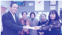
寄附をする老連役員、各サークルの皆さん

今年度も皆様のあたたかいご協力により1,304,046円(達成率100.3%)の善意が寄せられました。なお、この義援金は村社会福祉協議会を通して村内の生活に困っている方や体の不自由な方、ひとり暮らしのお年寄り、寝たきりのお年寄りは、楽しいお正月を迎えていただけるよう年末激励金とし、村民生委員児童委員を通してお届けいたしました。毎年の変わらぬご協力に対しお礼申し上げます。