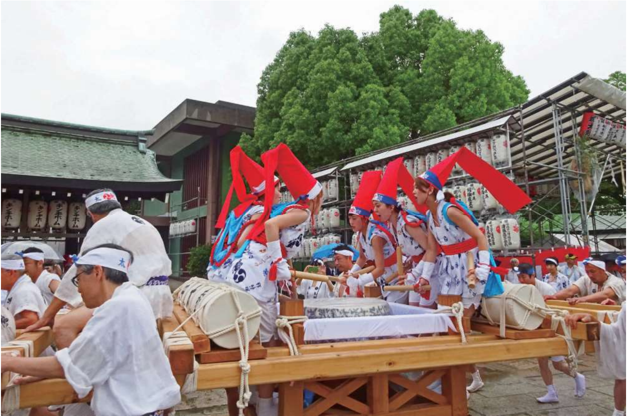
いくたまの夏祭り (大阪市 生國魂神社)

〒540-0012 大阪市中央区谷町1丁目5番4号 電話(06)6944-9040 FAX(06)6944-9050 URL http://kinzeisei.jp/ e-mail info@kinzeisei.jp