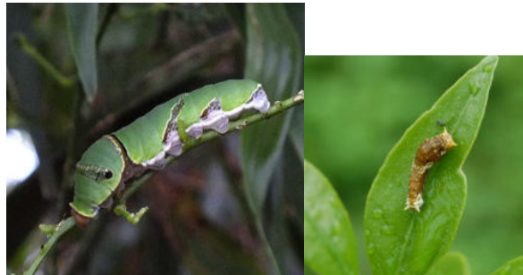
シロオビアゲハ 食草シークワサー他ミカン類