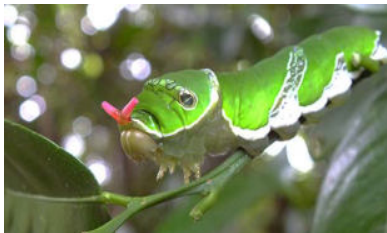
ナガサキアゲハ 食草シークワサー他ミカン類