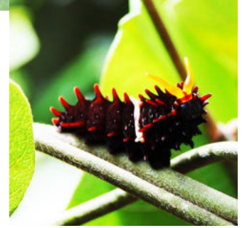
ジャコウアゲハ 食草リュウキュウマ ノススクサ