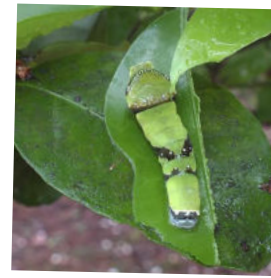
モンキアゲハ 食草シークワサー、 ハマセンダン