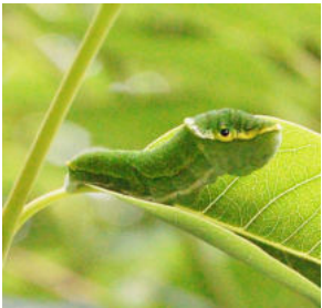
オキナワカラスアゲハ 食草ハマセンダン

初夏のチョウ類は繁殖のシーズン、アゲハチョウ科の幼生期を紹介します。公園内では見つけられない種類もありますが、本島北部に生息する種類です。ぜひ探して見つけてください。