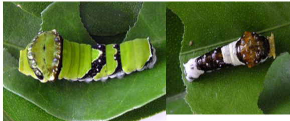
クロアゲハ 食草シークワサー他ミカン類