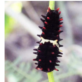
ベニモンアゲハ 食草リュウキュウマノススクサ