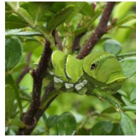
ナミアゲハ 食草ヒレザンショウ