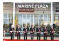
マリンプラザあがり浜