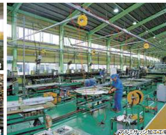
アルミサッシ加工工場