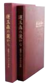
「運玉森の麓から」 金秀グループ 六十年史発刊