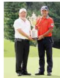
第85回日本プロゴルフ選手権大会 日清カップヌードル杯 開催