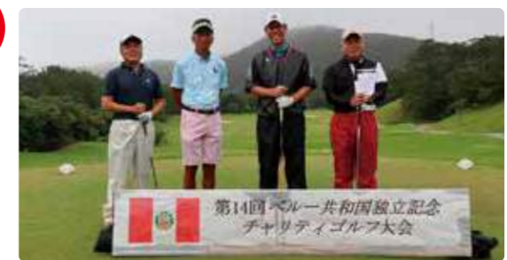
ペルー共和国独立記念チャリティゴルフ大会