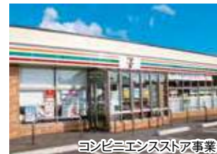
コンビニエンスストア事業