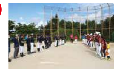
金秀グループ大運動会 ※2020年はソフトボール大会を実施