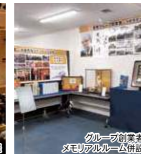
グループ創業者 メモリアルルーム併設