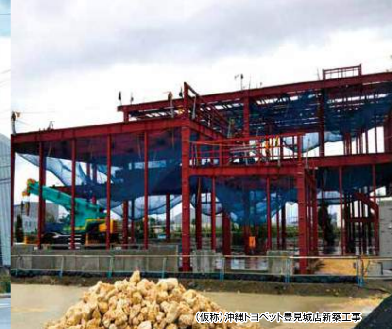
(仮称)沖縄トヨペット豊見城店新築工事