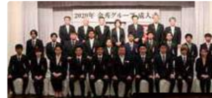
金秀グループ成人式