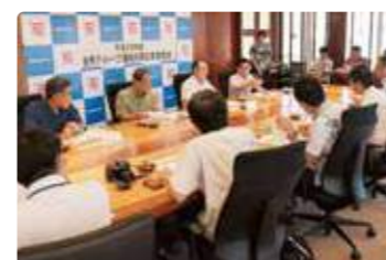
金秀グループ 連結決算発表