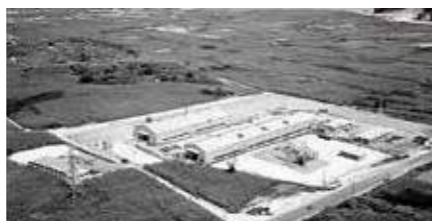
設立当時の沖縄軽金属 (現 金秀アルミ工業株式会社)