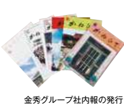
金秀グループ社内報の発行