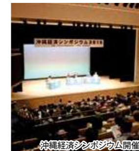
沖縄経済シンポジウム開催