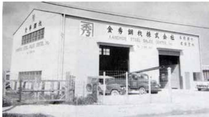
設立当時の金秀鋼材社屋

昭和46年 金秀アルミ工業株式会社設立 昭和43年 「鉄と琉球」発刊 昭和36年 金秀鋼材株式会社設立 昭和22年 企業免許取得「翁鉄工所」設立