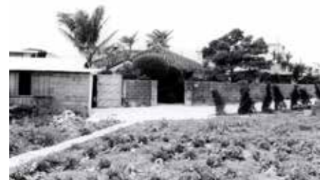
御殿下がりの生家