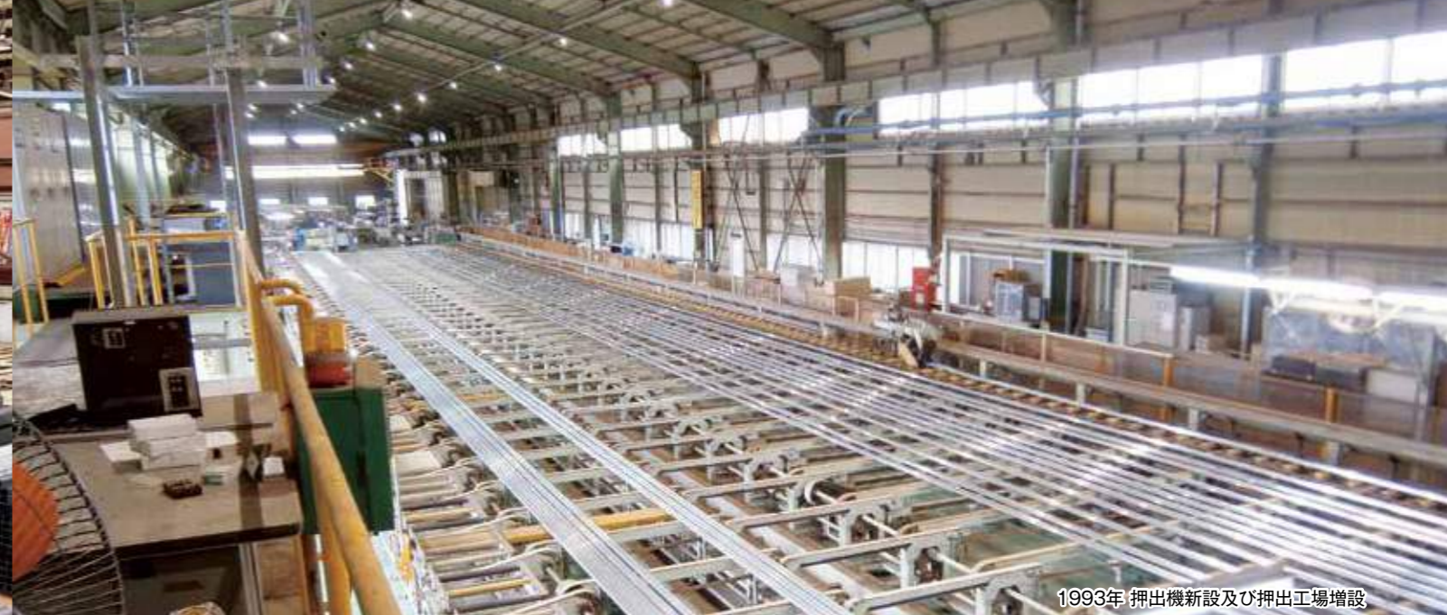
1993年 押出機新設及び押出工場増設