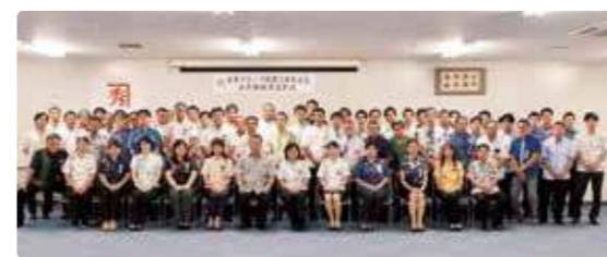
金秀グループ永年勤続表彰