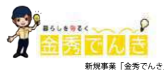
新規事業「金秀でんき」