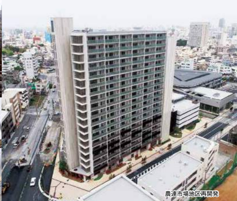
農運市場地区再開発