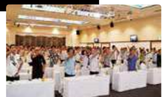
金秀グループ安全衛生大会