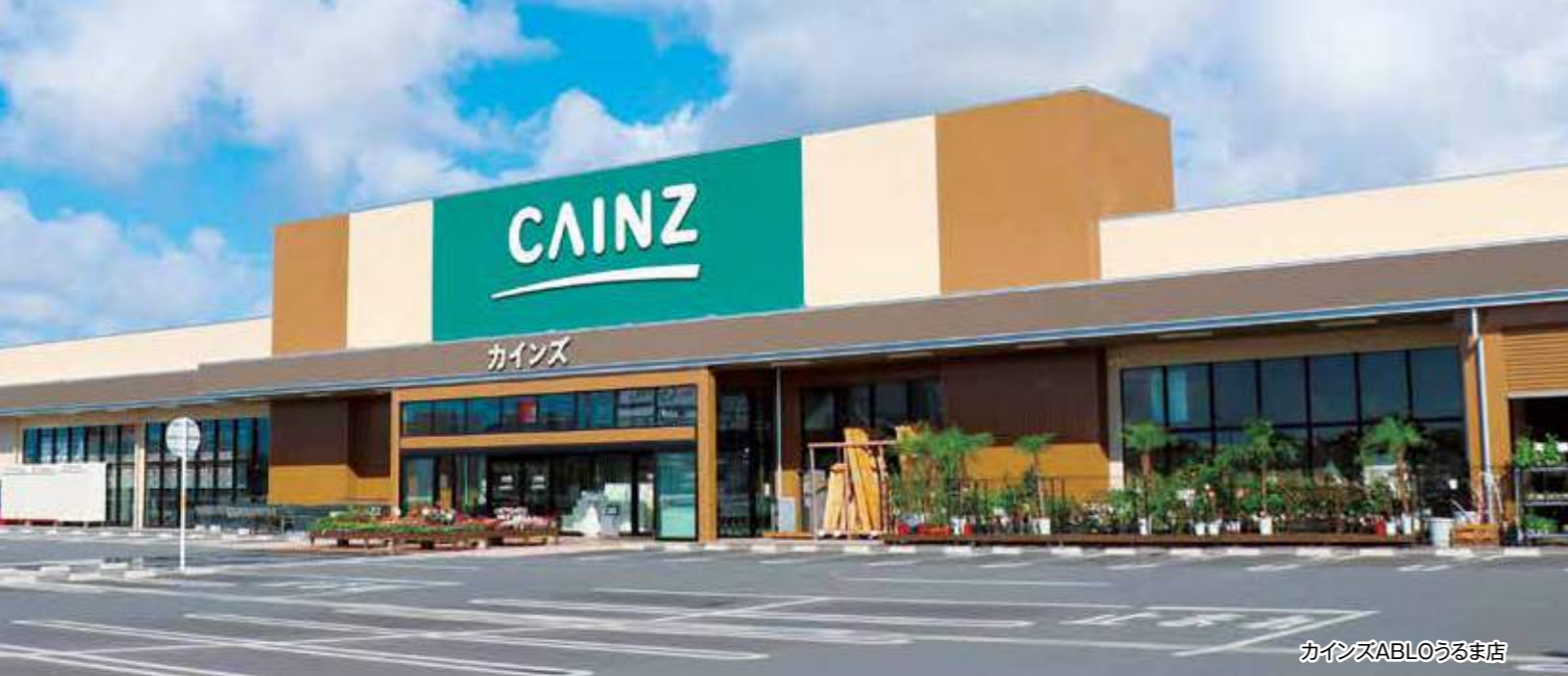
カインズABLOうるま店