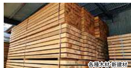
各種木材・新建材