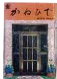
金秀グループ会報 「かねひで」創刊号