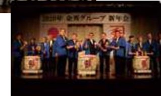
金秀グループ新年会