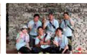
金秀グループ新入社員研修