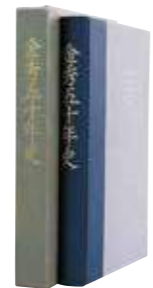
「金秀グループ 五十年史」 発刊