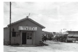
美田時代の金秀鉄工所 / 1950年