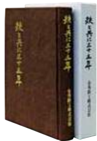
金秀鉄工 「鉄と共に三十五年」発刊