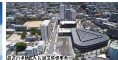
農連市場地区防災街区整備事業