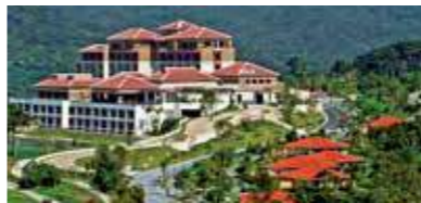
喜瀬別邸HOTEL&SPA (現ザ・リッツ・カールトン沖縄)