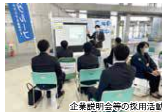
企業説明会等の採用活動