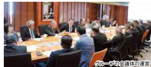
グループの会議体の運営