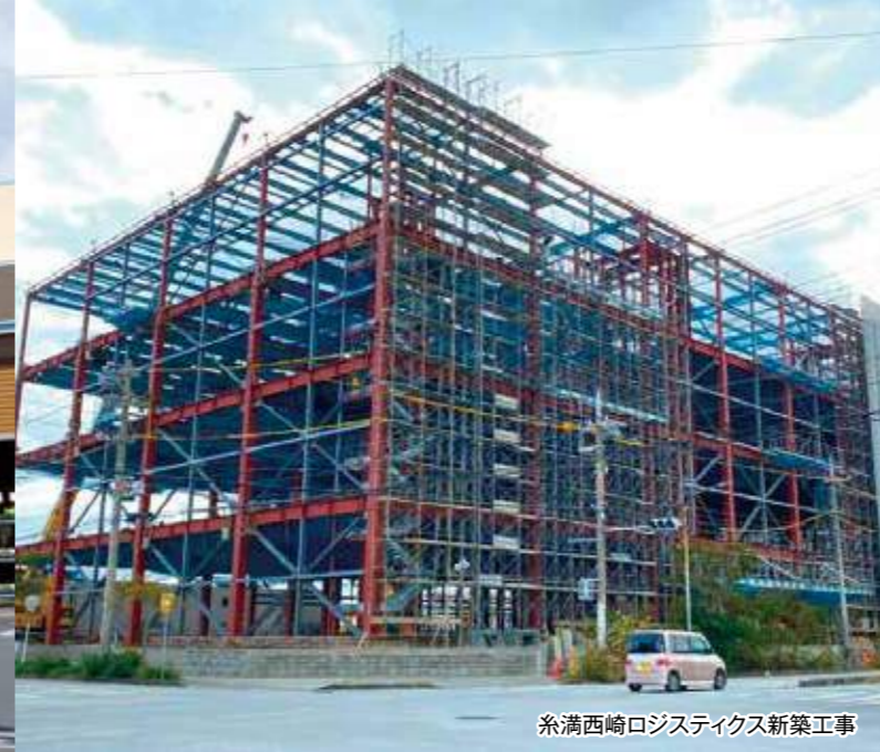
糸満西崎ロジスティクス新築工事