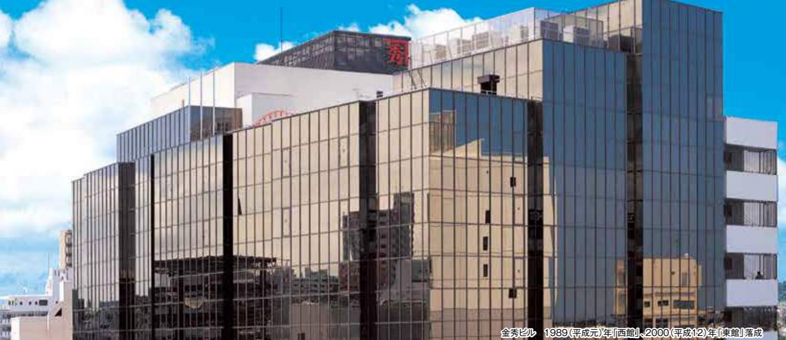
金秀ビル 1989(平成元年)年「西館」、2000(平成12)年「東館」落成