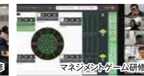
マネジメントゲーム研修