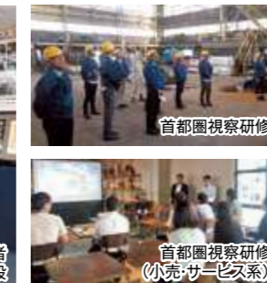
首都圏視察研修 (小売・サービス系)