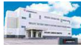
平成28年 金秀商事株式会社 新社屋完成