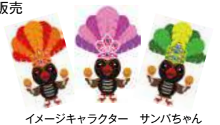
イメージキャラクター サンバちゃん