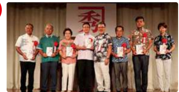
金秀グループ創業記念チャリティーゴルフ大会