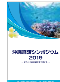
「沖縄経済シンポジウム2019」小冊子

また、研修制度につきましては内容と整合性を吟味し、様々な業容・業態を抱える各社に適したあり方を提言し充実化を図ります。