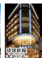
琉球新報 本社ビル