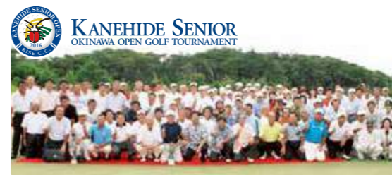
金秀シニア沖縄オープンゴルフトーナメント