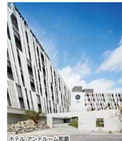
ホテル アンテルーム那覇