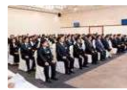
金秀グループ合同入社式