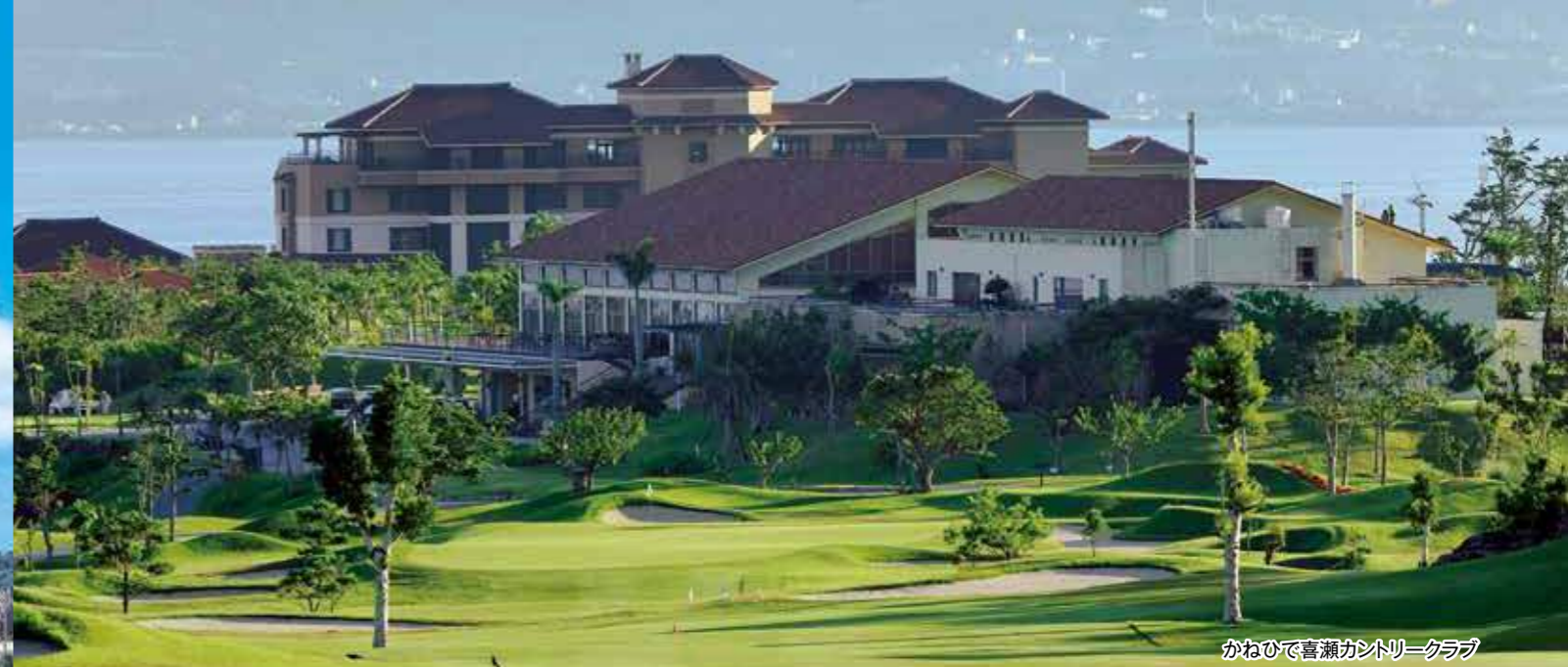
かねひて喜瀬カントリークラブ