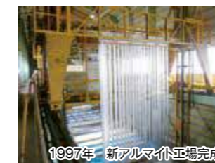
1997年 新アルマイト工場完成