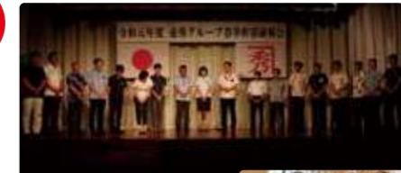
金秀グループ 幹部研修会 (春季・秋季開催)