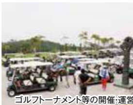
ゴルフトーナメント等の開催・運営