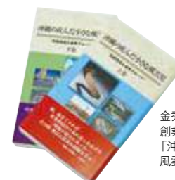
金秀グループ 創業65周年記念誌 「沖縄の産んだ小さな 風雲児(上下巻)」