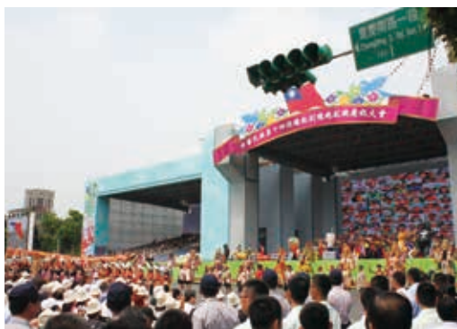
多彩なパフォーマンス

蔡総統率いる新政権が、どのように台湾を改革していくのか。今後も国内及び国外から高い関心が寄せられると見られる。