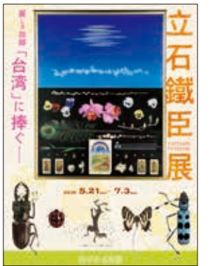
油彩画家・立石鐵臣の展覧会「麗しき故郷『台湾』に捧ぐー立石鐵臣展」

日本統治時代の台湾で活躍した油彩画家・立石鐵臣の展覧会「麗しき故郷『台湾』に捧ぐー立石鐵臣展」が5月21日から7月3日まで、府中市美術館で開催される。同展では、立石鐵臣氏が大コレクター福島繁太郎に贈った「台湾画冊」を日本初公開する。観覧料は一般700円、高校生・大学生350円、小学生・中学生150円。また、関連企画として、6月19日に特別ギャラリートーク「父、立石鐵臣について」(講師:立石光夫)、6月5日に「台湾近代美術と立石鐵臣おみ」(講師:森美根子)、6月26日に講演会「立石鐵臣おみという画家」(講師:志賀秀孝)が開催されるほか、水彩画やアクリル絵の具で細密画に挑戦するワークショップも開催される予定。詳細は府中市美術館 HP へ → https://www.city.fuchu.tokyo.jp/art/kikakuten/kikakuitiran/tateishitetsuomi.html 問い合わせ→ハローダイヤル Tel:03-5777-8600