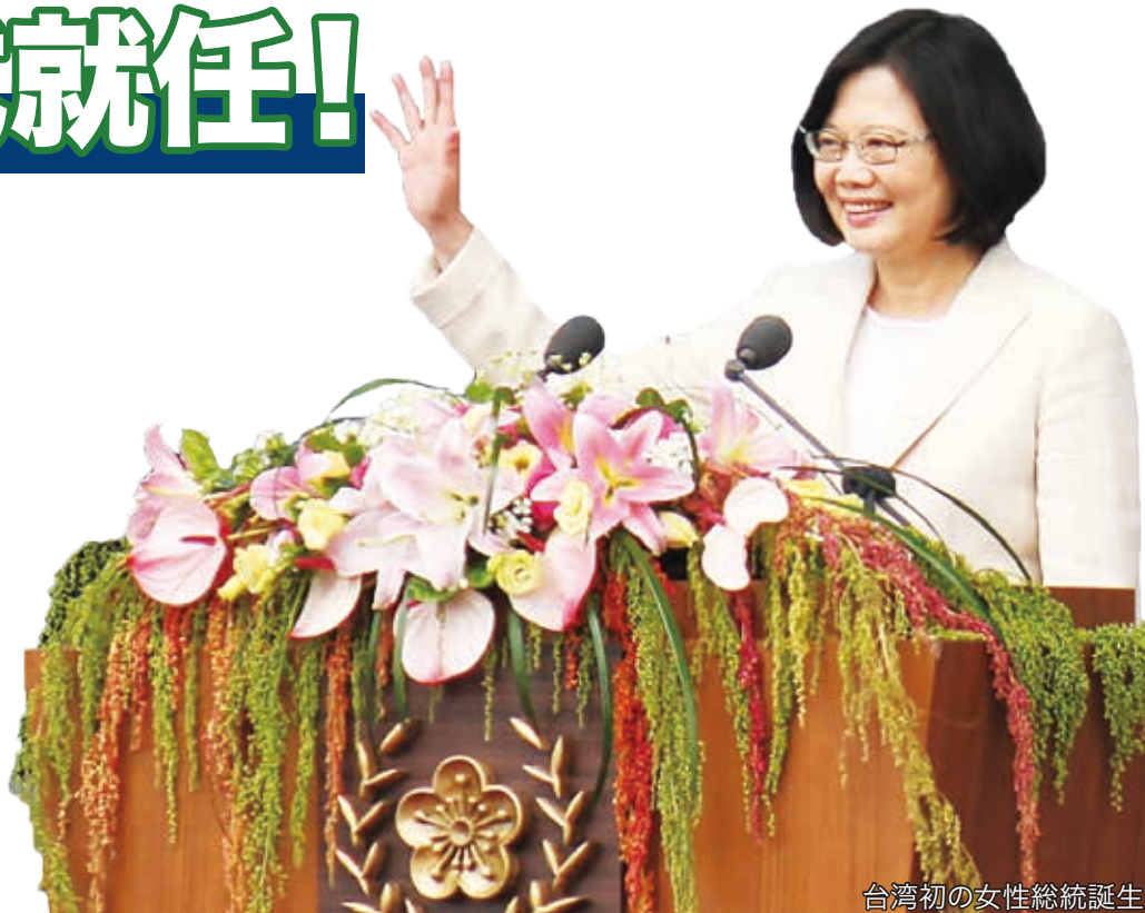
台湾初の女性総統誕生

日本側は、菅官房長官が5月20日の記者会見で、「台湾はわが国にとって基本的な価値観を共有し、緊密な経済関係と人的往来を有する重要なパートナーであり、大切な友