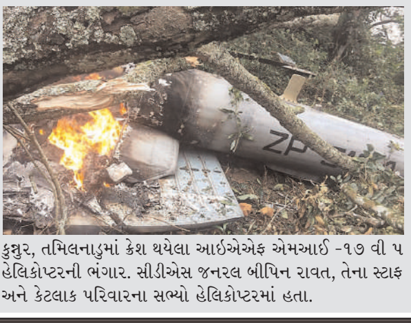
કુચ્છ, તમિલનાડુમાં ક્રેશ થયેલા આઈએએફ એમઆઈ-૧૭ વી ૫ હેલિકોપ્ટરની બંગાર. સીડીએસ જનરલ બિપિન રાવત, તેના સ્ટાફ અને કેટલાક પરિવારના સભ્યો હેલિકોપ્ટરમાં હતા.

પાછળ ના રહી જઈએ. સુરક્ષાની દ્રષ્ટિએ ભારતીય સીમા પર અસ્થિરતાના માહોલ છે અને ભવિષ્યમાં આ એક સળગતી સમસ્યા બની શકે છે. ચૌધરીએ વાયુસેનામાં અને તેમાં સ્વદેશી ઉપકરણોને સામેલ કરવા પર પણ ભાર મૂકીને કહ્યું હતું કે, ભારત હવે આક્રમક દ્રષ્ટિકોમ અપનાવી રહ્યું છે.