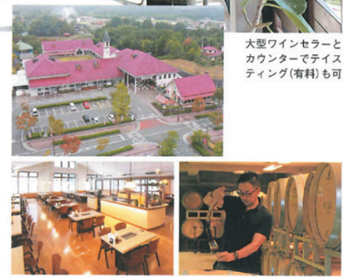
大型ワインセラーとカウンターでテイティング(有料)も可

ぶどうの栽培から収穫、醸造まで行い、製造過程の見学や試飲ができるワイナリー。三次のワインと特産品がそろった物産館、広島和牛とワインが堪能できるバーベキューガーデンやカフェがあり、四季折々のイベントも楽しい。 ☎ (0824)64-0200 三次市東酒屋町10445-3 🕒 物産館 9:30~18:00 バーベキューガーデン 11:00~18:00(L.O.17:30) カフェヴァイン 7:30~17:00(L.O.16:30) 📅 1月~3月の第2水曜日、12月29日~1月1日 🅐 100台 🅑 品有 🌐 http://www.miyoshi-winery.co.jp/