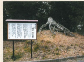
山家一里塚跡（県史跡）

「従は南備後國 従は南藝州領 三次郡横谷村」と刻まれた国境碑が赤名峠の旧道に立っている。享保5（1720）年に立てられたもので、現在も広島県と島根県の県境になっている。