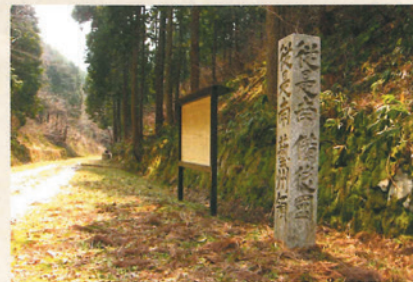
赤名峠の国境の碑

「従は南備後國 従は南藝州領 三次郡横谷村」と刻まれた国境碑が赤名峠の旧道に立っている。享保5（1720）年に立てられたもので、現在も広島県と島根県の県境になっている。