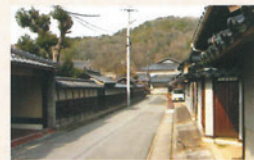
吉舎の古い町並み

吉舎の町筋は下素麺屋一里塚跡から南に延び、吉舎の巴橋を渡って世羅・上下方面に延びていた。江戸時代は宿場として栄えており、その面影を偲ばせる町並みが今も各所に残っている。