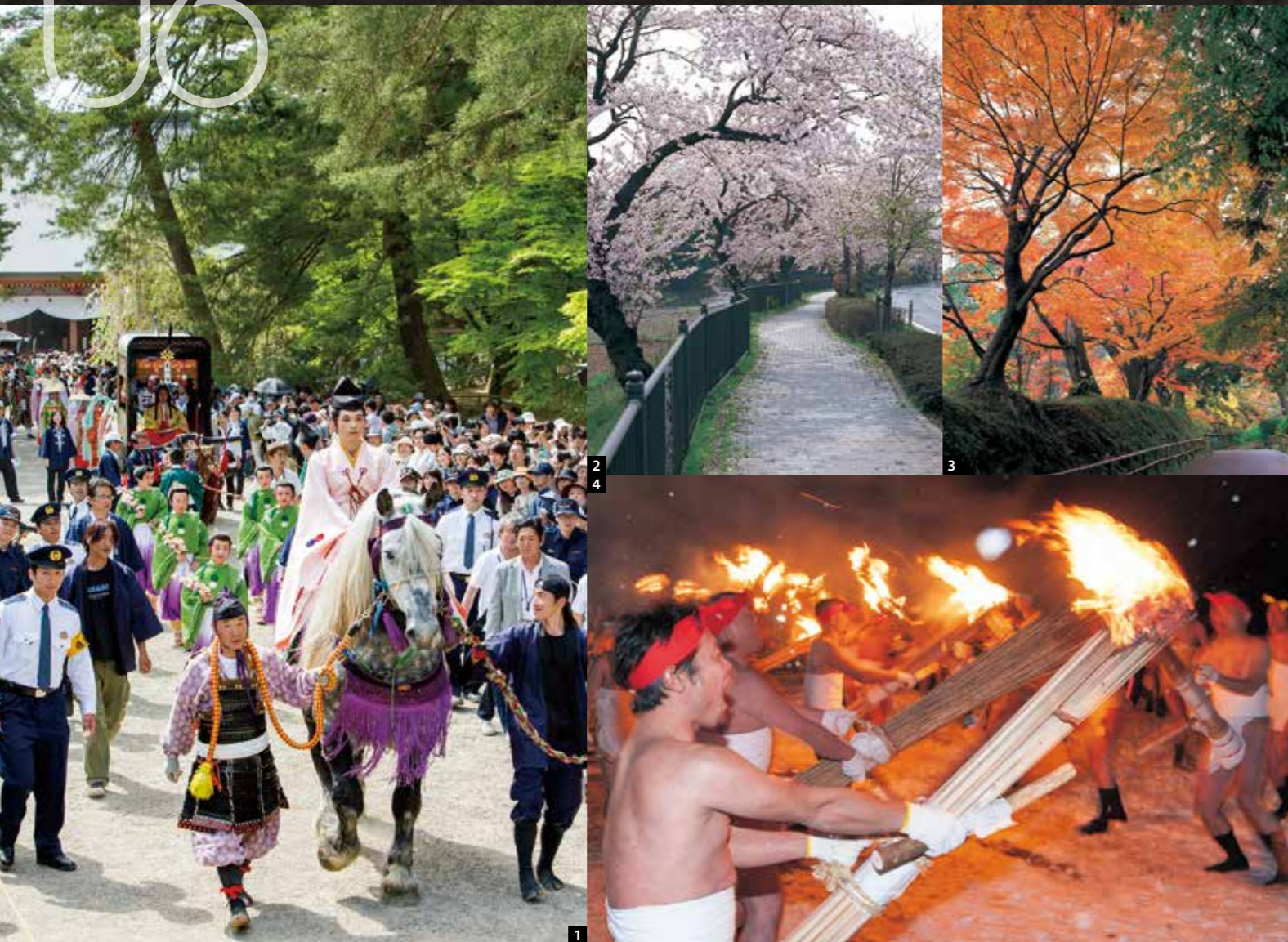
1. 藤原春祭【5月1日~5日】(照片为3日的源义经公东下游行) 2. 樱花林荫道(县道300号线) 3. 中尊寺参拜道(月见坂) 4. 毛越寺二十日夜祭【1月20日】