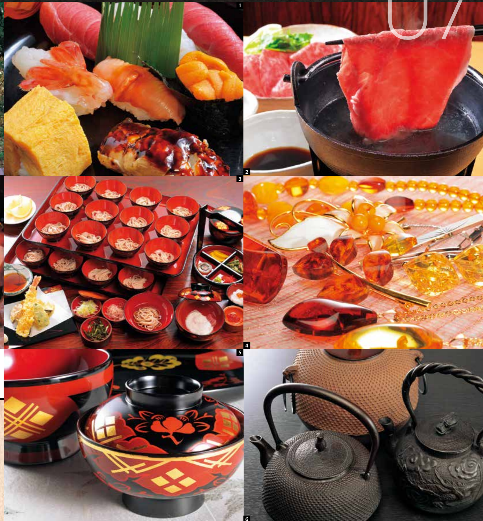
1. 寿司 2. 前泽牛的涮涮锅 3. 盛出式碗子荞麦面