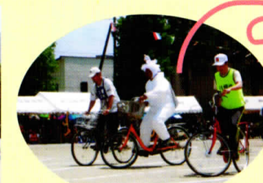
ユニークなコスチューム