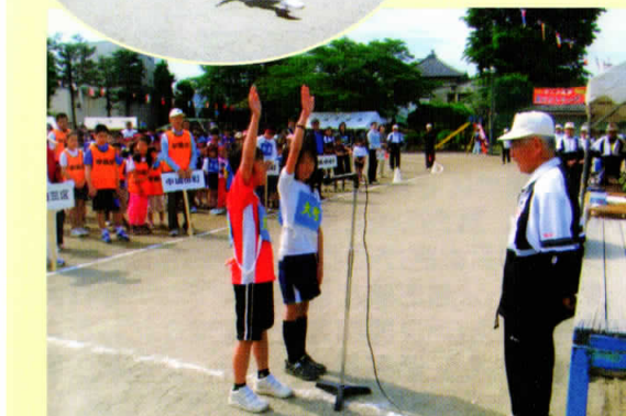
青空のもと、正々堂々と!!