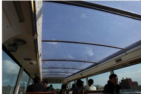
②開閉式ポリカーボネート屋根