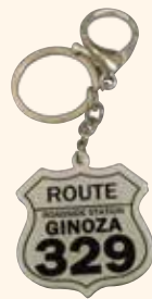
ルートキーホルダー ¥680