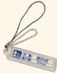
道の駅「ぎのぞ」ストラップ ¥520