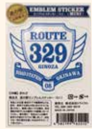
エンブレムステッカー ¥300