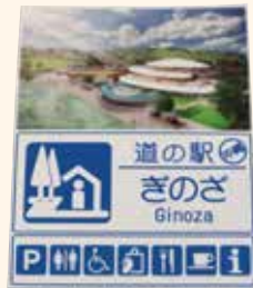
道の駅「ぎのぞ」マグネット ¥520