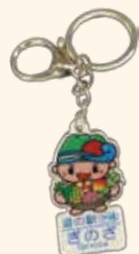
ぎ〜のくんキーホルダー ¥620

宜野座村マスコットキャラクター「ぎ〜のくん」が特産物を抱えた可愛いキーホルダーや道の駅公式ロゴが記されたステッカーなどお土産として喜ばれること間違いなし！