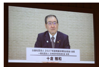
2027年国際園芸博覧会協会 会長 十倉 雅和