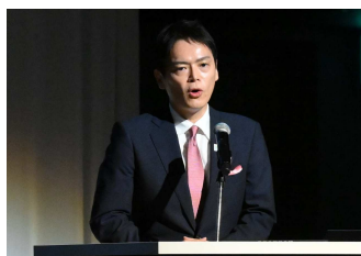
横浜市長 山中 竹春