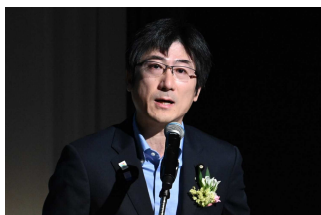
農林水産大臣政務官 舞立 昇治