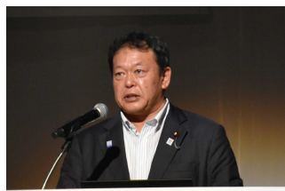
経済産業大臣政務官 石井 拓