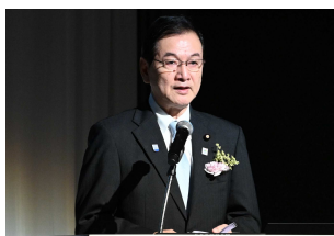
国土交通副大臣 堂故 茂