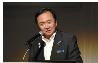
神奈川県知事 黒岩 祐治