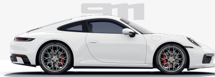
911 Carrera S