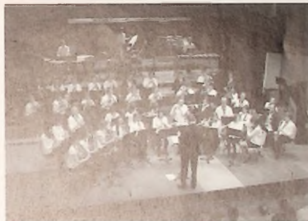
L'Orchestre de chambre d'harmonie de la FMSM Nord-Pas-de-Calais