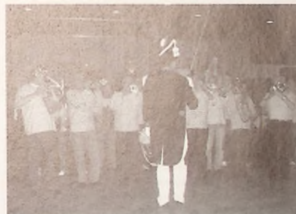
Les Sings de Mars