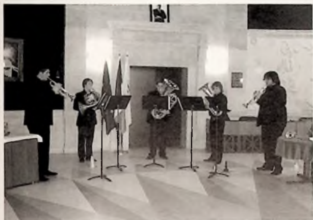
L'ensemble de cuivres «Valenciana Brass Quintet»