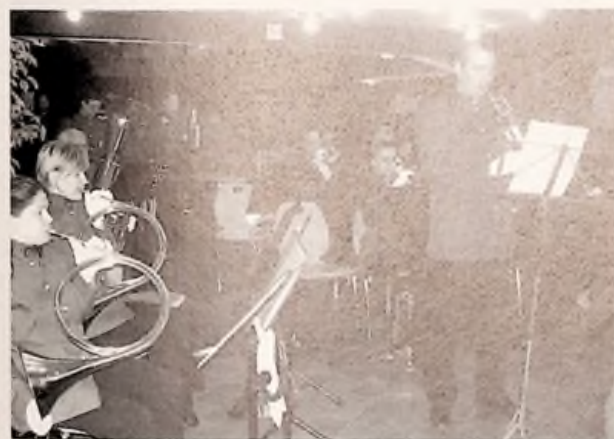
La Batterie fanfare de Lambertart