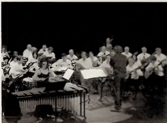
L'Estudiantina d'Argenteuil en concert