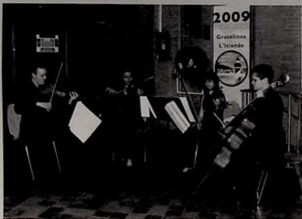
Le quatuor à cordes Pizzicati