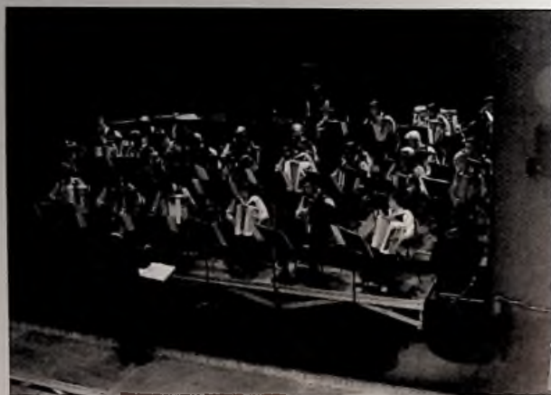
L'Orchestre d'accordéons de st-Pol sur Mer