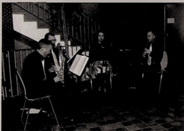
Le quatuor de clarinettes «les sans prises de becs» Avion.