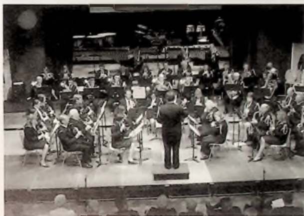
L'Orchestre d'harmonie de Gravelines