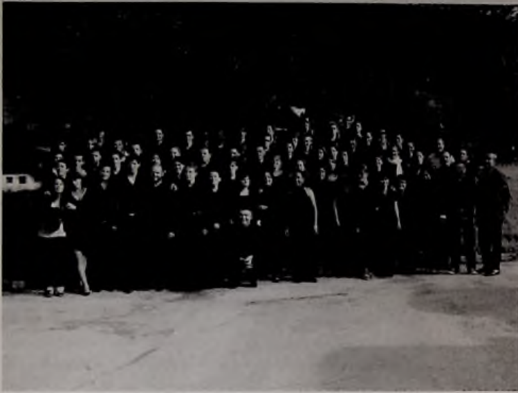
Photo de groupe de l'orchestre national d'harmonie des jeunes.