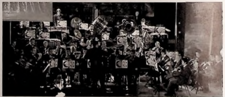
Concert de Nouvel An