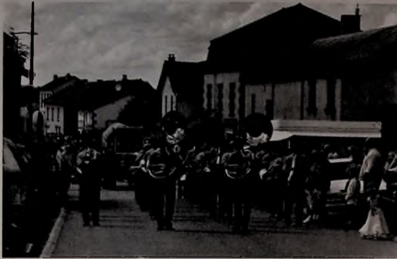
Fête à Chapdes Beaufort