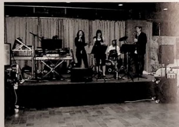
L'Orchestre de variétés de Gravelines