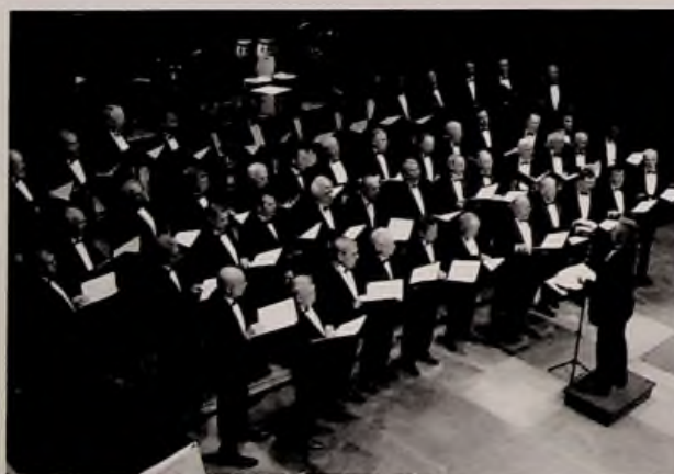
La Chorale d'homme «la lyre Halluinoise»