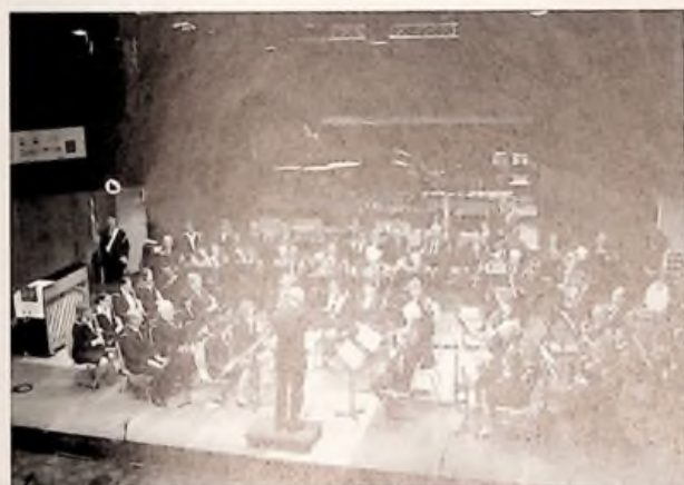
L'Orchestre d'harmonie de Cambrai