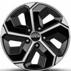
16-Zoll-Leichtmetallfelgen, serienmäßig bei Hybrid und Plug-in Hybrid