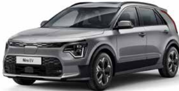
Stahlgrau Metallic (KLG)