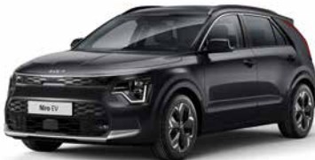
Auroraschwarz Metallic (ABP)