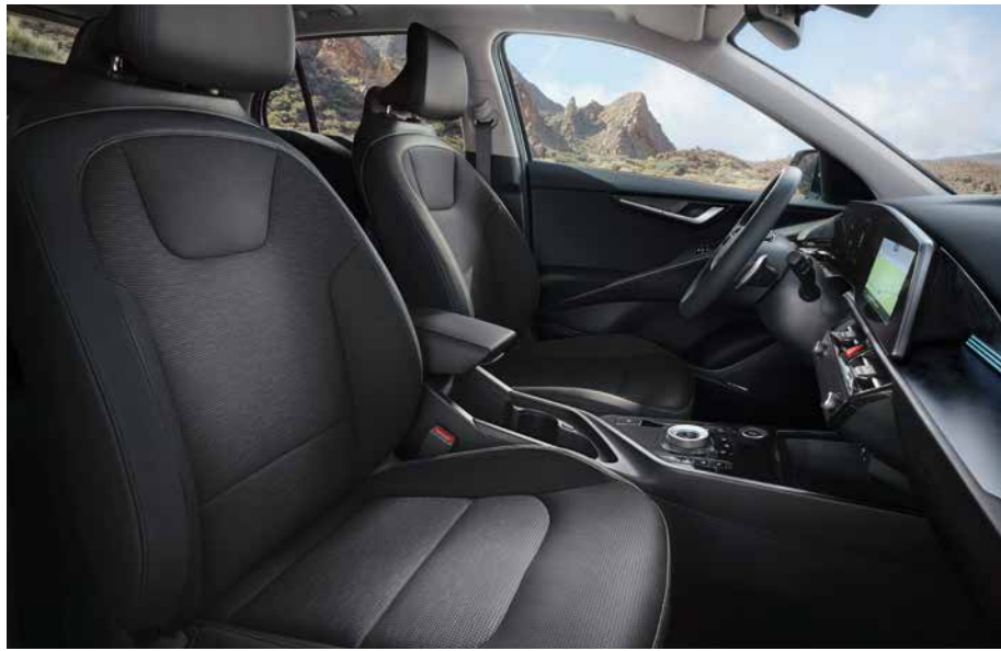
Sitzbezüge in hochwertiger Ledernachbildung, Charcoal (CCV) (Spirit und Inspiration).