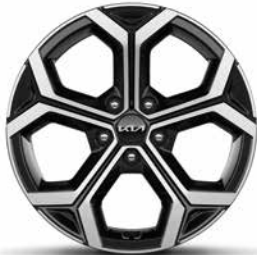
18-Zoll-Leichtmetallfelgen, nur für Spirit (Hybrid und Plug-in Hybrid)