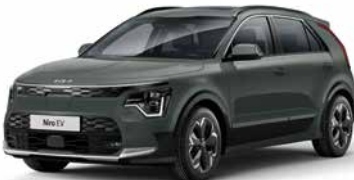
Cityscape Grün Metallic (CGE)