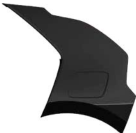
Auroraschwarz Metallic (ABP)