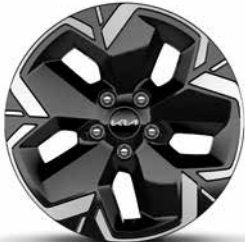
17-Zoll-Leichtmetallfelgen, nur für EV