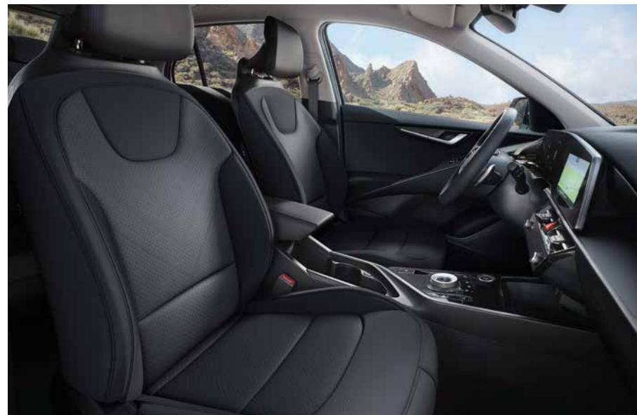
Sitzbezüge in Stoff, Charcoal (CCV) (Edition 7).

Je nach Ausstattungsvariante kannst du zwischen Stoff, veganer Stoff-Leder-Kombination (mit hochwertiger Ledernachbildung) und hochwertiger veganer Ledernachbildung wählen. Dabei ist vor allem die Ledervariante ein echter Hightech-Bezug, denn sie enthält Tencel™, eine aus Eukalyptusholz gewonnene Naturfaser, die für ein noch natürlicheres Gefühl sorgt.