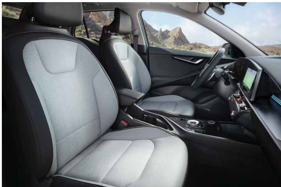
Sitzbezüge in hochwertiger Ledernachbildung, Bright (GYT) (optional für Spirit und Inspiration).