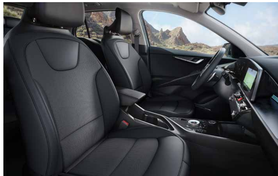
Sitzbezüge in Stoff-Leder- Kombination (mit hochwertiger Ledernachbildung), Charcoal (CCV) (Vision).