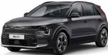
Interstellar Grau Metallic (AGT)