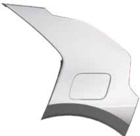
Stahlgrau Metallic (KLG), nur für EV