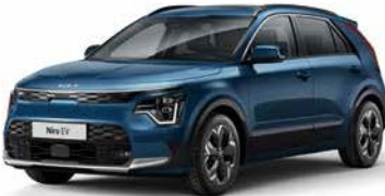
Mineralblau Metallic (M4B)