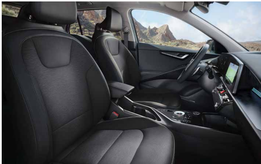
Sitzbezüge in hochwertiger Ledernachbildung, Charcoal-Grau (DFS) (optional für Spirit und Inspiration).