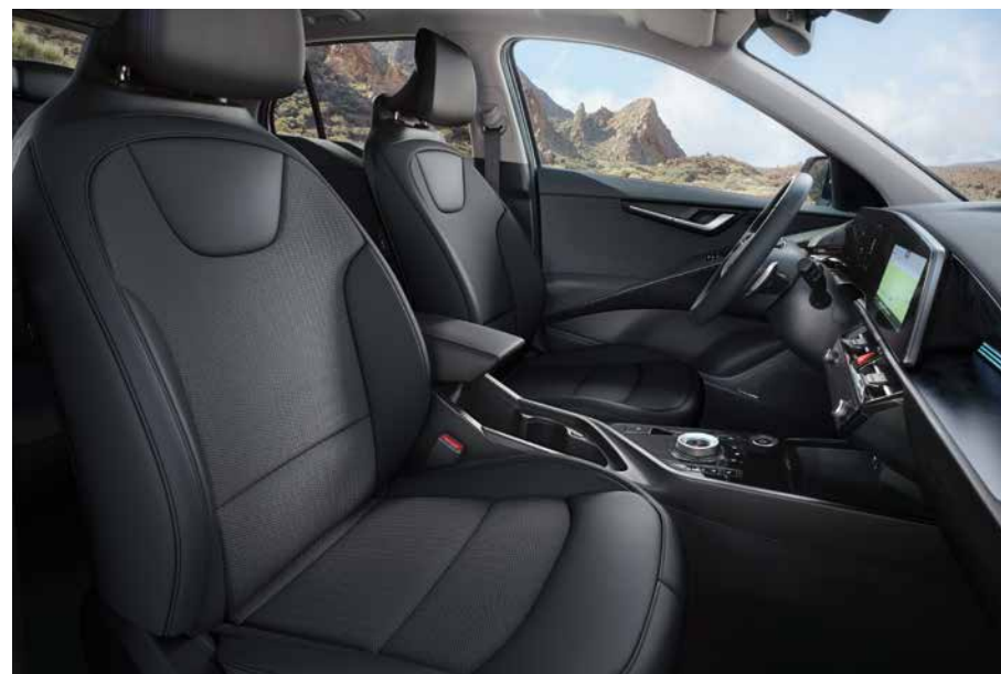
Sitzbezüge in Stoff-Leder- Kombination (mit hochwertiger Ledernachbildung), Charcoal- Grau (DFS) (optional für Vision).