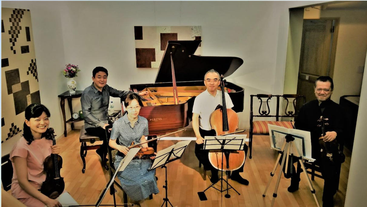
リハーサル風景 (2018年 軽井沢)