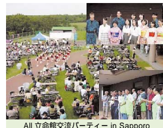
All 立命館交流パーティー in Sapporo

8/31 (土) 立命館慶祥中学校中庭にて開催。慶祥中・高の生徒、父母、卒業生に加え、道内各地から駆けつけた本学校友や慶祥高校の前身旧札幌経済高等学校の卒業生も多数参加。総勢700名で野外パーティーを楽しんだ。