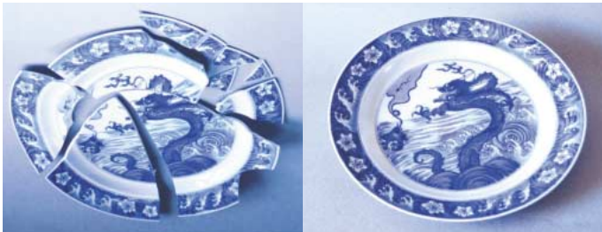
明朝大鉢 直径25cm深さ15cm 10分割 一部欠落あり (左)修復前 (右)修復後

修理・修復と併記するのは理由がある。修理とは壊れた陶磁器を使う状態に戻すことで、いわゆる“金継ぎ”が伝統的手法である。割れや欠けを漆で繕い、その上に金を施す。道具に新たな風情が加わったとして喜ばれもする日本独特の美学である。一方の修復は西洋で発達した技術で、外観を全く元通りにするものだが、食器