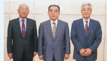
左から、 呂顧問、 鄭会長、 裴常任顧問