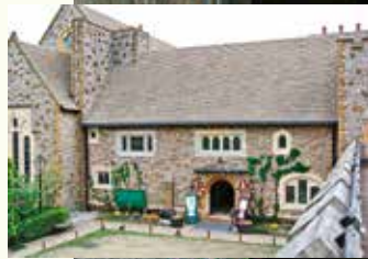
那須ステンドグラス美術館