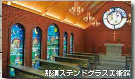
那須ステンドグラス美術館