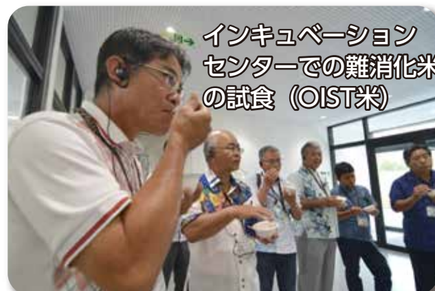
インキュベーション センターでの難消化米 の試食 (OIST米)