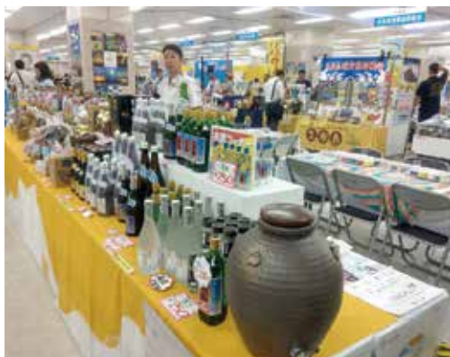
サンシャインシティー 恩納村ブース

10日間での物産展における来 場者数は8万8千3百98名、前年 度9万8百39名となっております。 恩納村ブースへの来客者のカウ ントはとれておりませんが、恩納村 ブースの一角で観光協会が沖縄そ ばを期間中6千食販売したとの 報告を受けております。