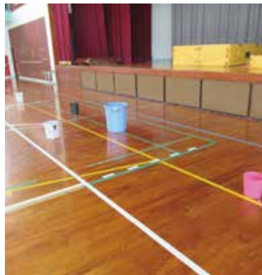
仲泊校体育館の雨もり状況

児童生徒がけがをしないよう、 学校への注意喚起も促しながら点 検調査し早急に対応したい。