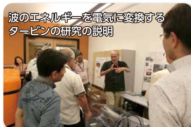
波のエネルギーを電気に変換する タービンの研究の説明