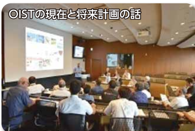
OISTの現在と将来計画の話