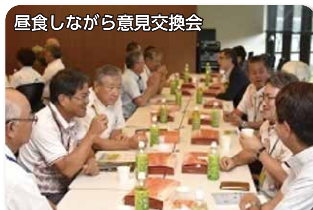
昼食しながら意見交換会