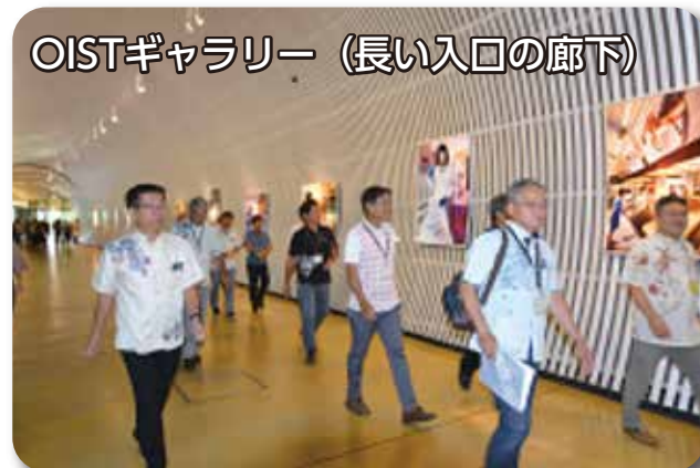
OISTギャラリー (長い入口の廊下)