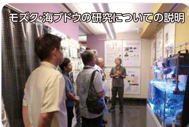
モズク・海ブドウの研究についての説明