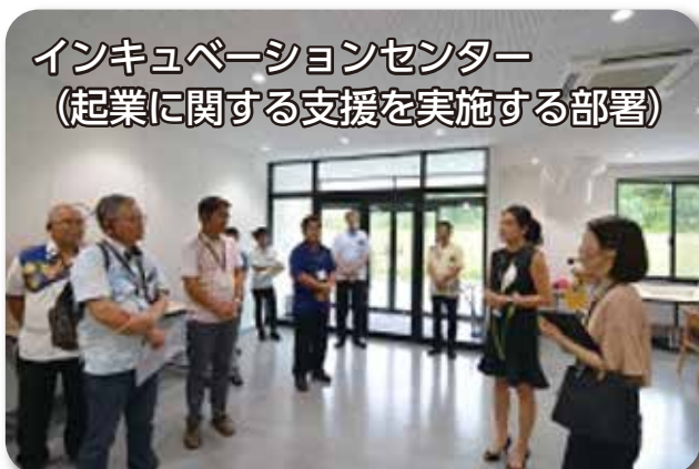
インキュベーションセンター (起業に関する支援を実施する部署)