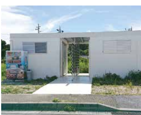
前兼久漁港仮設トイレ

質 平成31年2月28日に、漁協よりトイレの利用について施設利用料を1ショップあたり年間5万円の料金の徴収についてのお願いの説明会が開催されており、4月11日にダイビング事業者へ漁協、ダイビング協会から、施設利用についての訂正、漁港施設維持管理協力金を支払うこととすること、正会員、賛助会員、一律2万円を年間支払うよう通知された。その施設はトイレ表示もない。金額等一切知らないと言ったんですが、運用するにあたっては旧トイレもあります。2カ所ともダイビング協会と漁業組合が管理しているのか。